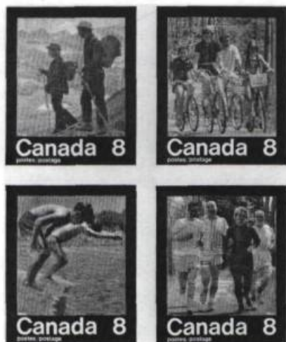
Timbres pré-olympiques émis en mars 1974 par le Ministère canadien des Postes.

Douze années après sa parution cette série n'est pas encore rare sur le marché. Mais alors que le contribuable essaie d'oublier le déficit olympique et que les collectionneurs se relèvent de