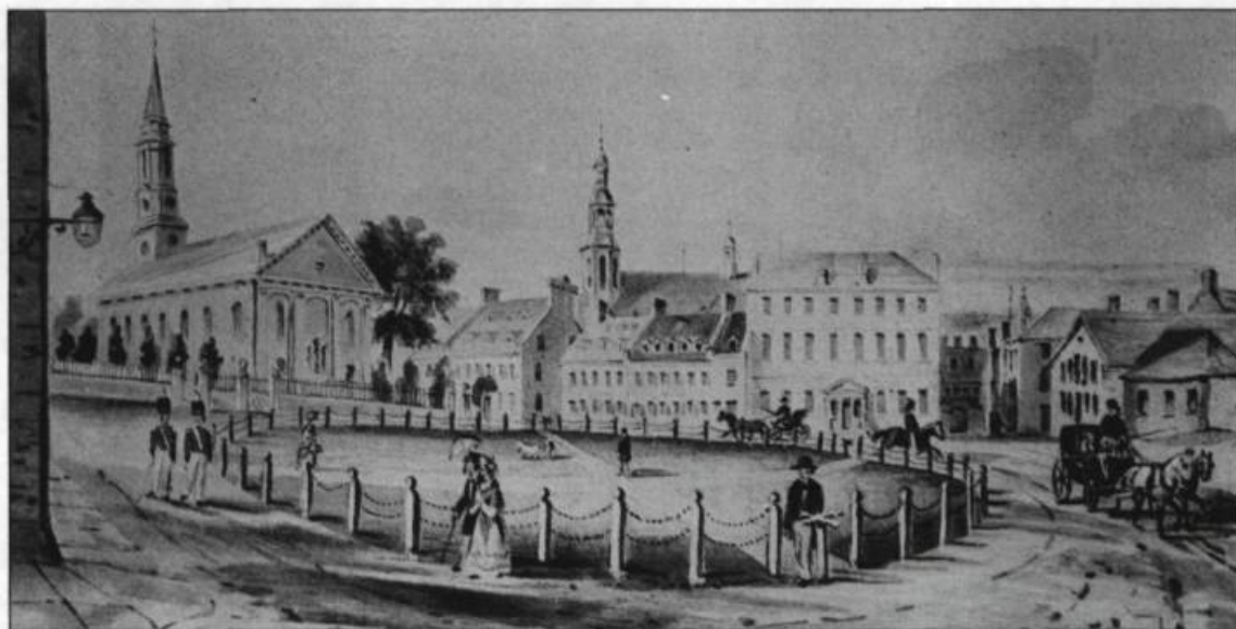
La Place d'Armes en 1832. Des poteaux reliés par des chaînes servaient à délimiter un terrain de courses pour les chevaux. A. Bourne.