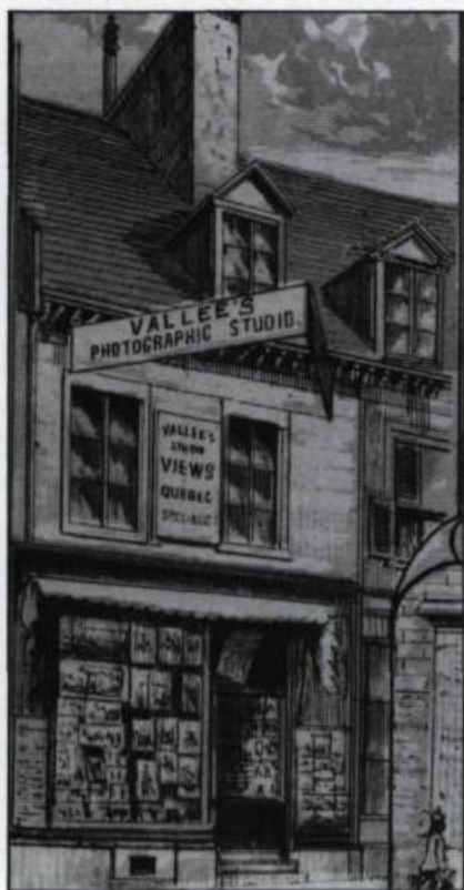
Studio de photographie de Louis-Prudent Vallé, sis au 39 rue Saint-Jean. Gravure 17 x 6cm tirée de The City of Quebec Jubilee Illustrated, 1887.

jeux organisées, des salles de musique équipées, des lieux de concerts en action. Avec ce regard neuf, Livernois offre le « raffinement de la civilisation » accessible à l'élite féminine de Québec.