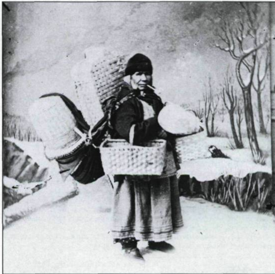
L'exotisme ethnique. L'Indienne vendeuse de paniers. Demi-stéréogramme, vers 1863, signé L.-P. Vallée mais possiblement réalisé par G.W. Ellison. (Coll. privée).

Une production originellement destinée aux touristes; l'Ontario participe elle aussi à ce marché. Non seulement les clichés pris à Québec