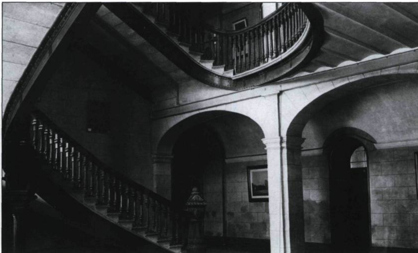
La modernité, Séminaire de Québec, départ du grand escalier de fonte. Épreuve 5" x 7", vers 1885, par Ernest Livernois. (Coll. privée).

sible dans l'architecture et l'urbanisme, la respiration de la ville: les rues achalandées de la basse-ville, pavées de madriers; l'architecture coloniale française, éloquente dans les maisons de pierre de la Place royale, du marché Finlay; les marchés publics animés, peuplés d'habitants en étoffe du pays et garde-manger de l'élite militaire, administrative et cléricale; le cliché en calèche, comme en propose Vallée dans sa publicité; la promenade sur la terrasse Dufferin; les rues «fashionable» de la haute-ville, intra muros; les villas bourgeoises avec la vie de galerie des grands propriétaires, pas très loin de leur bel attelage...Des villas dans les styles anglais, néo-classique ou pittoresque, avec des serres, des jardins. L'histoire, inscrite dans ces colonnes à la mémoire du «brave Wolfe mourant et du non moins brave Montcalm expirant». Les efforts bien laborieux de rapprochements...les édifices administratifs centenaires, avec leur austérité de pierre, leurs voûtes sorties du fond des âges.