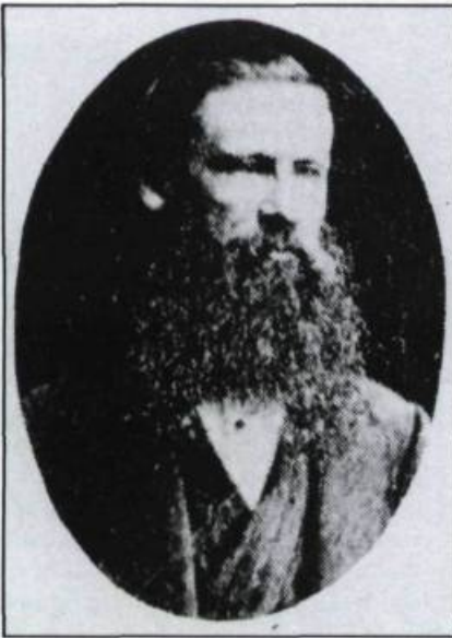
Autoportrait de Louis-Prudent Vallée vers 1875. (Coll. privée).