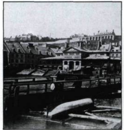
Le romantisme historique. La rue Petit-Champlain et le Marché Finlay vis du fleuve, la première signée Ellisson, la seconde L-P. Vallée. Demi-stéréogramme, vers 1870. (Coll. privée).

son, Irlandais d'origine et photographe à Québec depuis 1848.