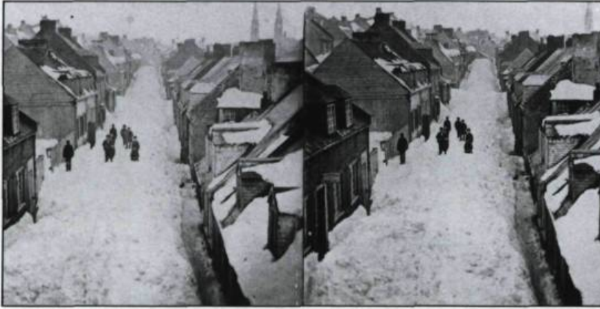
L'exotisme géographique. Neige dans les rues de Québec en mars. Stéréogramme de Louis-Prudent Vallée vers 1880. (Coll. de l'auteur).