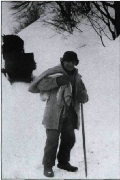
L'exotisme ethnique. Le quêteux de la Côte de Beupré. Épreuve 5" x 7", vers 1875, par Ernest Livernois. (Coll. privée).

partir de 1860, c'est l'enthousiasme: tous les pays, tous les artistes en produisent sur tout et sur rien. Des millions et des millions de cartes sont mises en circulation. Le grand public se découvre des vocations de collectionneurs et rassemble, dans de beaux albums offerts par un marché bien organisé, des portraits de grands personnages mais aussi des vues si-