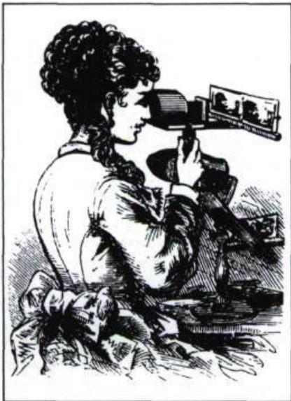
Gravure nous présentant une dame utilisant un stéréoscope pour visionner des épreuves photographiques par couple stéréoscopique. L'appareil donne l'impression du relief à trois dimensions. (Coll. privée).

partir de 1860, c'est l'enthousiasme: tous les pays, tous les artistes en produisent sur tout et sur rien. Des millions et des millions de cartes sont mises en circulation. Le grand public se découvre des vocations de collectionneurs et rassemble, dans de beaux albums offerts par un marché bien organisé, des portraits de grands personnages mais aussi des vues si-