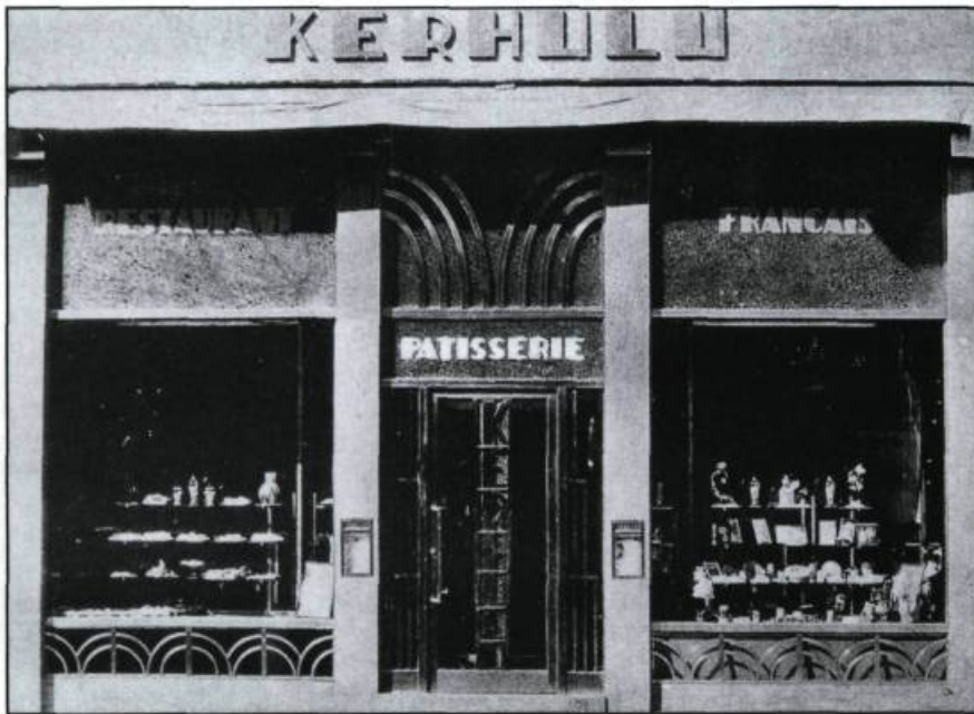
Maurice Genevoix, de passage à Québec en 1939, écrit que le restaurant Kerbulu était à son époque le meilleur établissement du genre au Canada. Carte postale.

tons, en réalité, ils constituent de loin les plus loyaux sujets de Sa Majesté. La politesse et la courtoisie générale de ces gens, qui s'amuse comme des petits fous à chaque hiver, l'ont frappée! Cette appréciation idyllique néglige pourtant un volet fondamental, noté par plusieurs, de la vie québécoise, celui de la stricte séparation des «races». N.P. Willis note, en 1839, que si la vie sociale s'y déroule d'une manière généralement plus gaie que dans la moyenne des villes coloniales, les différentes classes ne se fréquentent pas entre elles. Les Français, plus raffinés à ses yeux, souffrent du dédain de leurs maîtres anglophones. Bigsby note, lui aussi, l'étanchéité des relations sociales. Les Canadiens français, d'après lui, mènent une vie sociale fort active entre eux, mais côtoient rarement les anglophones, sauf lors des occasions officielles au Château Saint-Louis.