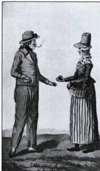
Habitants en costume d'été. Tiré de: John Lambert, Travels Through Canada, 1816.

Haute-ville et basse-ville: la distinction remonte aux origines de Québec. Tous les voyageurs ont noté les deux niveaux d'habitation, le passage unique par la Côte de la Montagne, le site «imprenable» du Cap-aux-Diamants. Les voyageurs s'épargnent souvent des mots en référant les lecteurs à leurs prédécesseurs. Les Anglais, nous dit le Duc Bernhard de Saxe-Weimar en 1825, comparent facilement Québec à Gibraltar. Charles