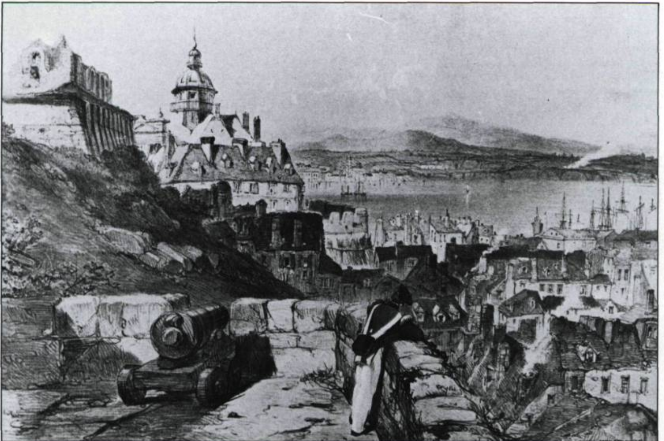
Prise du promontoire, cette vue de Québec avec sa Citadelle dominant la basse-ville et le fleuve, son château Saint-Louis en ruines illustre bien l'aspect moyenâgeux signalé par Henry Thoreau. Gravure d'après un dessin de Coke Smyth pour Sketches with Canadas , 1840. (Coll. privée).

Un demi-siècle plus tard, en 1893, la comtesse d'Aberdeen, en reportage photographique au Canada, n'ose décrire la situation. Elle conseille à ses lecteurs de regarder les illustrations de son livre pour constater la beauté des lieux. Et elle aime bien le peuple québécois. Il s'agit pour elle d'un peuple « frugal, satisfait, respectueux des lois et religieux »; toujours de simples paysans normands et bre-