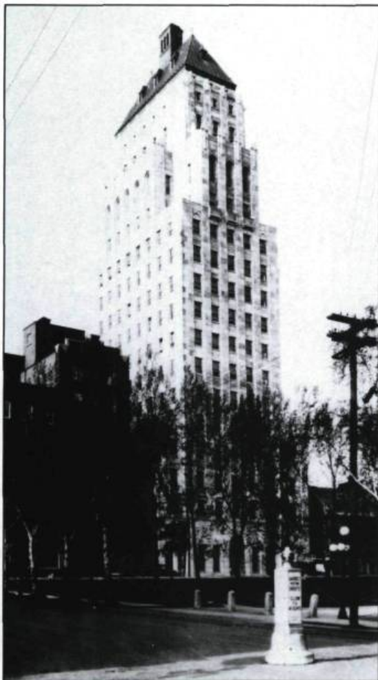
L'édifice Price, «premier gratte-ciel de Québec», est inauguré en 1930. Tiré du journal Le Soleil , 11 décembre 1929. (Archives nationales du Québec, Québec).

François-Xavier Chouinard affirme dans une lettre écrite en 1935 que le permis de construction a été octroyé en novembre ou décembre 1928, au moment où, en raison d'une querelle avec le Conseil municipal au sujet de son mandat, la Commission n'était pas en possession de tous ses pouvoirs. Chouinard s'explique en ces termes: « Quand la Commission reprit son activité, en vertu du règlement 115B, Price House était déjà en construction malgré qu'à ma connaissance personnelle les Commissaires se soient fortement objectés à son érection en dedans des vieux murs de fortifications et spécialement le savant historien, Colonel William Wood... Price House tout en étant un enrichissement immobilier et d'une intéressante architecture n'était pas, rue Ste-Anne, à sa place parmi tant de vieux monuments. Coin de la Couronne et St-Joseph ou en un endroit similaire, cet édifice aurait mieux paru, au milieu des grandes bâtisses commerciales. Ainsi donc, la Commission ne peut, en justice, être blâmée pour un acte dont elle n'était pas responsable. »