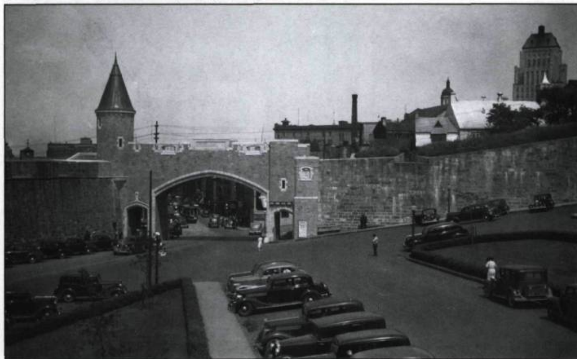
Photo prise lors de l'inauguration de la porte Saint-Jean en juillet 1939.

d'une génération. De plus, ces mouvements sont généralement associés à des tournants dans le développement économique. Autre constante, les initiatives de destruction proviennent toujours du monde des affaires et sont justifiées au nom du «progrès moderne». Enfin, les améliorations technologiques dans le domaine des transports servent dans les trois cas de prétexte au déclenchement du processus.