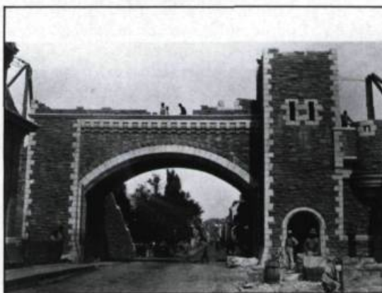
La nouvelle porte Saint-Louis fut édifée en 1878 d'après les projets de lord Dufferin, dessinés par W.H. Lynn, et les plans de Charles Bailly. (Archives nationales du Québec, coll. Initiale).

d'une génération. De plus, ces mouvements sont généralement associés à des tournants dans le développement économique. Autre constante, les initiatives de destruction proviennent toujours du monde des affaires et sont justifiées au nom du «progrès moderne». Enfin, les améliorations technologiques dans le domaine des transports servent dans les trois cas de prétexte au déclenchement du processus.