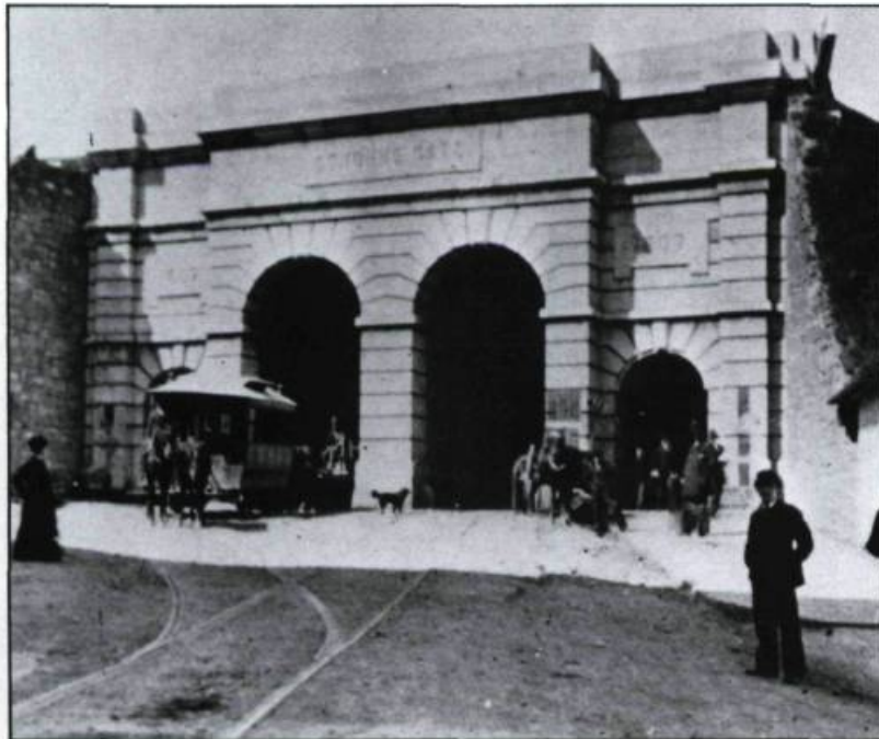
Photographie de la porte Saint-Jean nous montrant un tramway tiré par des chevaux. La porte fut construite en 1867 et démolie en 1897..

En 1864, une entente intervient pourtant et les autorités militaires consentent à l'enlever à la condition expresse d'en construire une plus large. Un règlement municipal sanctionne cette intention en novembre. Mécontents, les citoyens réclament la disparition complète de l'ouvrage. Afin de régler le différend, les élus locaux et provinciaux convoquent, suivant la tradition, une assemblée de citoyens à l'Hôtel de ville pour le premier décembre. Deux ministres y participent: le président du Conseil exécutif, Isidore Thibaut, et François Évanturel, membre de la Chambre d'Assemblée et représentant du comté de Québec. Premier à prendre la parole, le ministre Évanturel note la faible participation des citoyens à une rencontre de cette importance, puis énumère les raisons qui, à ses yeux, justifient l'élimination des portes.