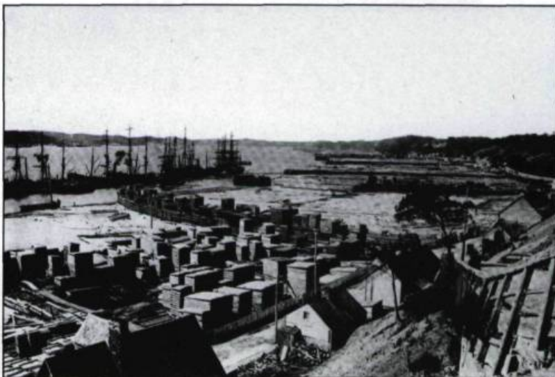
Le commerce du bois dans l'Anse de Sillery, 1890.

car ils occupent encore massivement les conseils d'administration de la plupart des institutions financières et des compagnies de transport et de services publics de Québec. La Quebec Bank, la Union Bank, le chemin de fer Québec et Lac Saint-Jean, la centrale électrique de la chute Montmorency et la compagnie de gaz sont les principales entreprises dont ils gardent le contrôle mais qu'ils céderont à des capitalistes canadiens plus puissants qu'eux dans les premières décennies du XXI ème siècle. Au sein de ces compagnies se trouvent des hommes d'affaires, descendants des plus illustres familles marchandes de Québec, tels les Price, Ross et Sharples. Au moment où Québec reprend progressivement son caractère français, le milieu financier garde ainsi bien vivante la mémoire des maîtres d'oeuvre du grand commerce maritime au XIX ème siècle. ♦