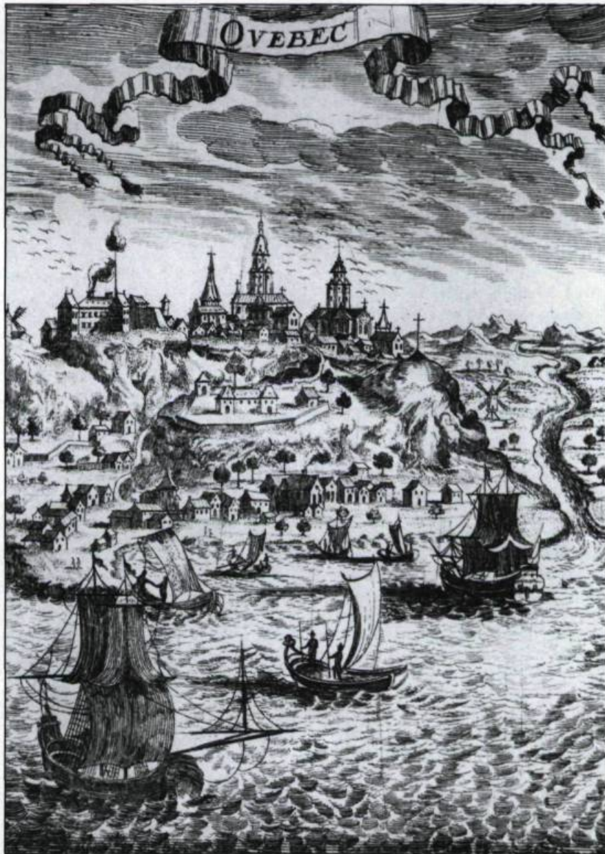
Cette gravure publiée en 1683 à Paris montre comment certains artistes manipulent la perspective afin de simplifier la vue. (Coll. Yves Beauregard).

Nous vous proposons donc de redécouvrir ici la vieille capitale par les yeux des artistes qui l'ont visité ou qui y ont séjourné. Oublions pour quelques instants le Québec des cartes postales récentes et faisons, à l'aide de ces artistes, le périple d'hier à aujourd'hui pour découvrir cette cité que Xavier Marmier décrivait en 1860 dans un style coloré: «ville de guerre et de commerce perchée sur un roc comme un nid d'aigle et sillonnant l'océan avec ses navires, ville du continent américain, peuplée par une colonie française, régie par le gouvernement anglais, gardée par des régiments d'Écosse, ville du moyen-âge par quelques-unes de nos anciennes institutions et soumise aux modernes combinaisons du système représentatif, ville d'Europe par sa civilisation, ses habitudes de luxe et touchant aux derniers restes des populations sauvages et aux montagnes désertes, ville située à peu près à la même latitude que Paris, et réunissant le climat ardent des contrées méridionales aux rigueurs d'un hiver hyper-