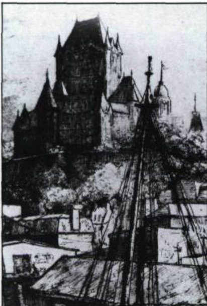
Les gravures contemporaines de Québec exploitent volontiers les sites plus touristiques de la Vieille Capitale. Simone Hudon, Le Château Frontenac à Québec , tiré de: Au fil des côtes de Québec , par Simone Hudon, 1967. (Archives de la ville de Québec).

l'impressionnisme et le fauvisme. Cette jeune génération, loin de se plier inconditionnellement aux nouvelles tendances artistiques, adaptera les principes de cet enseignement à une production canadienne fortement figurative et davantage conservatrice. Le Québec des Pilot, Cullen et Morrice, révélera l'apport européen et perdra de sa saveur documentaire, pittoresque ou exotique. Dès lors, les monuments, les marchés, les édifices seront le lieu et le motif où les jeux de lumière, les contrastes de formes et de couleurs viennent concurrencer l'objectif premier qu'est la mise en valeur du site. Le fossé se creuse peu à peu entre le motif privilégié par l'artiste et le mode d'expression.