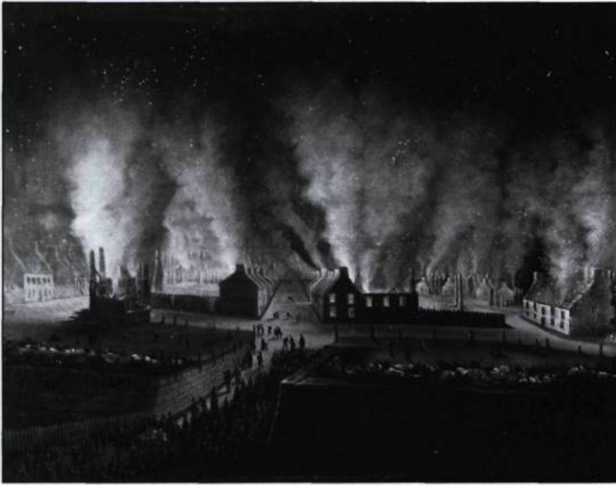
De conception romantique, mais plus respectueuses des réalités locales, les oeuvres de Joseph Légaré, moins stéréotypées que celles des peintres anglais, ouvrent la voie à une nouvelle approche du paysage canadien. Joseph Légaré. L'incendie du faubourg Saint-Jean, le 28 juin 1845.

resque, qui devait connaître une grande popularité auprès des amateurs. Empreint de romantisme, le vocabulaire formel de ce mouvement exploitait le côté sensationnaliste des sites. Les artistes usaient volontiers de ciels mouvementés, du fleuve déchaîné, d'édifices en ruines ou noyés dans la brume pour présenter Québec d'une manière théâtrale, saisissante et imposante. À l'aide de ces moyens picturaux, ils dramatisaient la scène et la rendaient évocatrice.