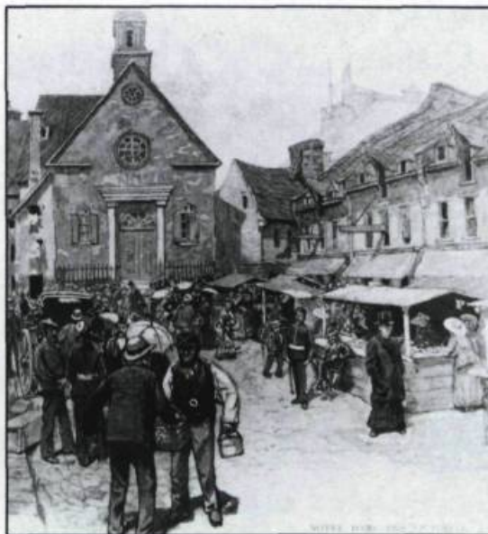
Scène de marché à la Place royale au début du XIXième siècle. Gravure, s.d. (Archives de la ville de Québec).

Le XXIème siècle voit s'accroître substantiellement la contribution de la France à l'architecture du Québec. D'abord du fait de l'influence de l'École des Beaux-Arts de Paris, qui accueille les architectes du Québec. Ensuite par la venue au Québec d'architectes français. Un de ceux-là, Maxime Roisin, donne à la ville plusieurs édifices importants; il dresse aussi les plans de monuments commémoratifs qui retracent les grands moments de l'histoire de la Nouvelle-France et dont les personnages de bronze proviennent d'ailleurs d'ateliers parisiens.