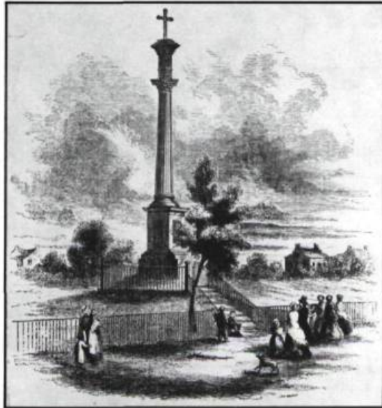
Ce monument érigé à Beauport en 1840, commémore une croisade de tempérance prêchée par le Père Mathieu. Gravure d'après un dessin de Samuel S. Kilburn. Tirée du Ballou's Pictorial Drawing Room Companion du 29 décembre 1855.

Au début du siècle présent, une première campagne, qui dura près de cinq années, connut le succès dans les alentours de la cité de Champlain. Les pasteurs misèrent sur la modération.