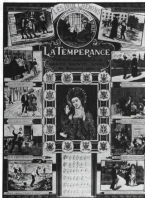
Les sociétés de tempérance des diocèses de la province distribuèrent des illustrations moralisatrices à leurs nouveaux adhérents. Image polychrome de L.-A. Morissette intitulée Les deux chemins présentant 10 scènes dichotomiques sur la tempérance. Ministère des Affaires culturelles, Québec.

Pour ouvrir une première brèche, ils prêchèrent contre la coutume de «traiter» au Jour de l'An: peu à peu, les consommations se rarifièrent à tel point dans les salons qu'on jugea de mauvais goût d'offrir «un petit verre» aux invités et aux visiteurs.