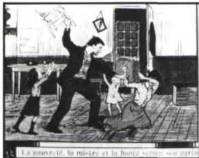
Deux des scènes de la gravure Les deux chemins de L.-A. Morissette, Montréal. Archives de folklore de l'Université Laval.