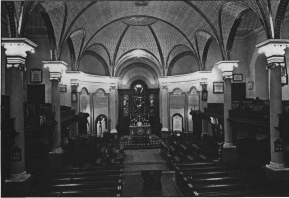
Intérieur de la cathédrale anglicane de la Sainte-Trinité érigée en 1804. La plaque commémorative de John Charlton Fisher se trouve dans la galerie nord.