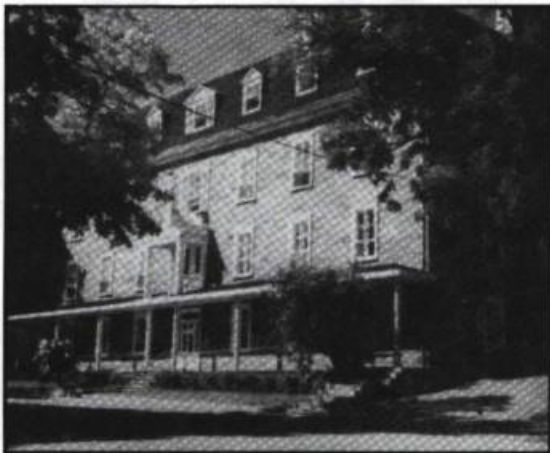
Couvent des religieuses de la Congrégation Notre-Dame arrivées à Saint-François en 1763. Érigé en 1882. Tiré du Programme Souvenirs, 1729-1979 de Saint-François de la Rivière du Sud.