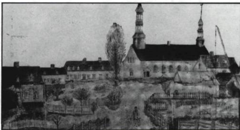
Village de Saint-Jean-Port-Joli vu du sud-ouest, avant 1872. Tiré de Ma paroisse, Saint-Jean-Port-Joli par Gérard Ouellet, 1946.

Les paroisses de la Côte-du-Sud s'équipent tout de même plus ou moins rapidement d'une infrastructure scolaire répondant aux objectifs des lois de 1841 et de 1846. En conséquence, l'alphabétisation croît dans la région: le pourcentage de signataires passe de 23 pour 100, entre 1840 et 1849, à 43,9 pour 100 entre 1860 et 1869. Ce progrès paraît encore plus significatif si