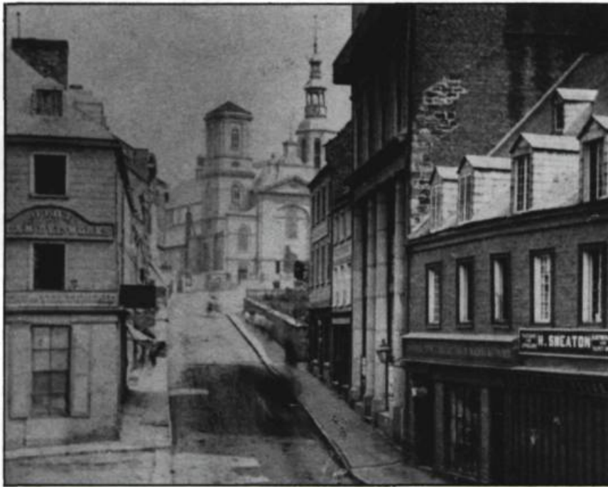
Démoli en 1898, lors des travaux d'élargissement de la Côte de la Fabrique, l'immeuble où logeait l'Institut canadien est l'oeuvre de Joseph Ferdinand Peachy. L'hôtel de ville, le palais Montcalm, l'église méthodiste wesléyenne et la bibliothèque Gabrielle-Roy accueilleront tour à tour la bibliothèque.