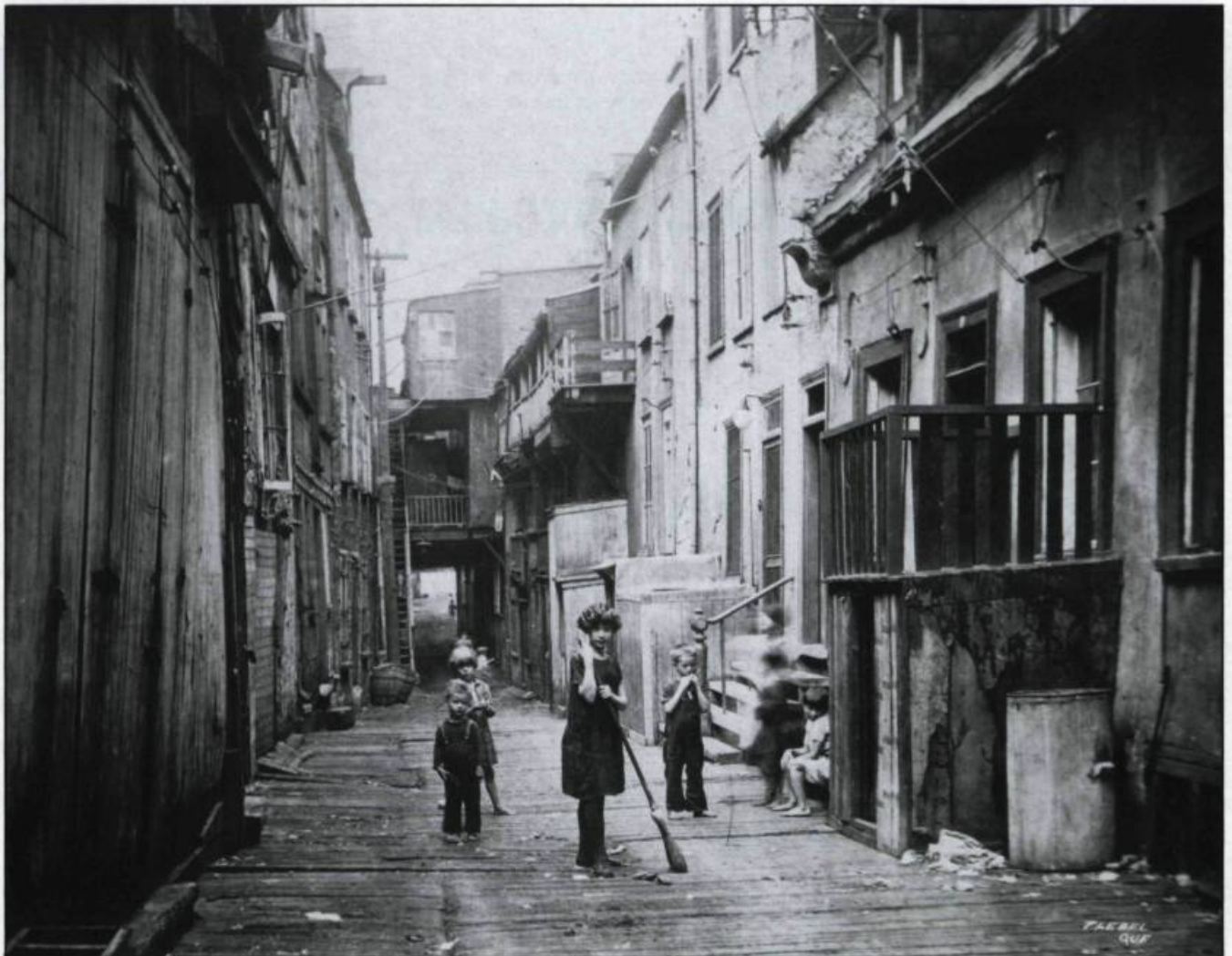
Jeunes enfants dans la rue Sous-le-Cap. Cliché pris au cours des années vingt. (Archives de la ville de Québec, Fonds Thaddée-Lebel).

Que dire de la rue des Bains dans une ville bien loin de la Floride! Ce nom n'a rien à voir avec le climat mais évoque plutôt les premiers bains publics installés à Québec en 1817. Reprenant notre promenade, nous remontons la Côte du Palais, empruntons la rue Saint-Jean, la Côte de la