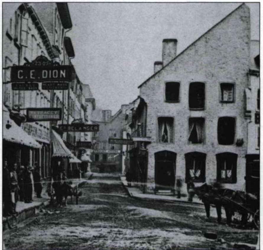
Photographie de la rue Notre-Dame en basse-ville vers 1865. Demi-stéréogramme.

On établit généralement à une quarantaine le nombre de rues tracées et