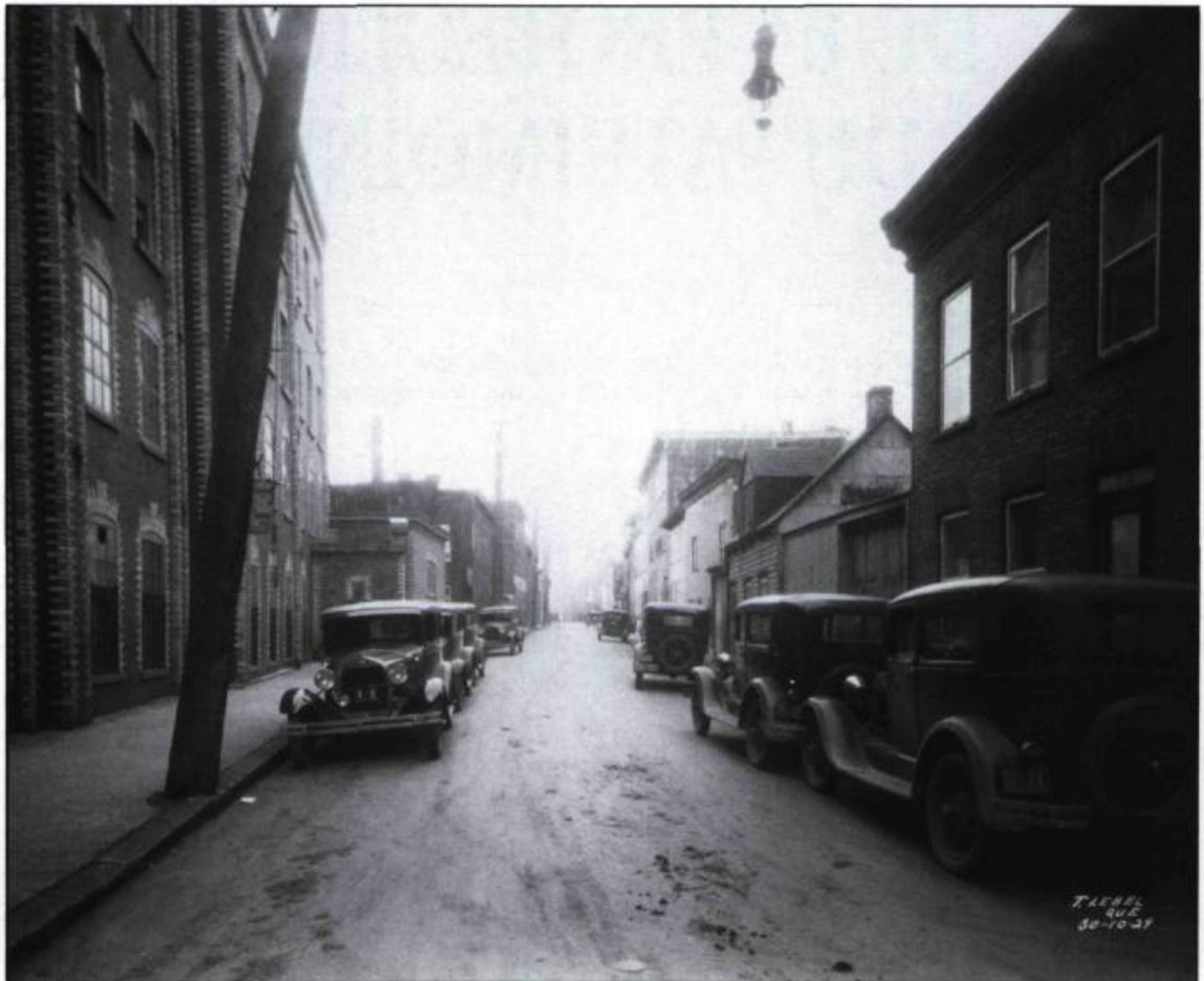
La rue Charest (de Dorchester à Caron avec à gauche la Dominion Corset) avant son élargissement en 1930 pour faciliter la circulation automobile.

En vue de protéger le caractère historique de la ville, la Commission décide d'abord de s'attaquer à la restauration des vieilles fortifications, en collaboration avec le gouvernement fédéral (projet de 50 000 $), et de rouvrir la promenade en bois qui ceinture la citadelle et rejoint la terrasse Dufferin. La presse s'empresse d'applaudir: «Cette promenade que l'on va rétablir est l'une des plus belles et des plus pittoresques qui soient dans une cité de l'Amérique...Le désappointement d'un grand nombre pour n'avoir pu aller sous les murs de la Citadelle ces années dernières a dû nous faire perdre beaucoup de touristes et par-