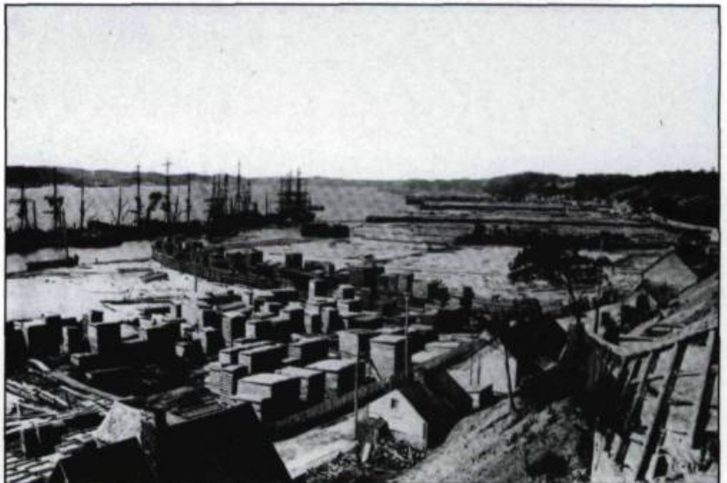
Le commerce du bois dans l'Anse de Sillery, 1890.

car ils occupent encore massivement les conseils d'administration de la plupart des institutions financières et des compagnies de transport et de services publics de Québec. La Quebec Bank, la Union Bank, le chemin de fer Québec et Lac Saint-Jean, la centrale électrique de la chute Montmorency et la compagnie de gaz sont les principales entreprises dont ils gardent le contrôle mais qu'ils céderont à des capitalistes canadiens plus puissants qu'eux dans les premières décennies du XX e siècle. Au sein de ces compagnies se trouvent des hommes d'affaires, descendants des plus illustres familles marchandes de Québec, tels les Price, Ross et Sharples. Au moment où Québec reprend progressivement son caractère français, le milieu financier garde ainsi bien vivante la mémoire des maîtres d'œuvre du grand commerce maritime au XIX e siècle. ♦