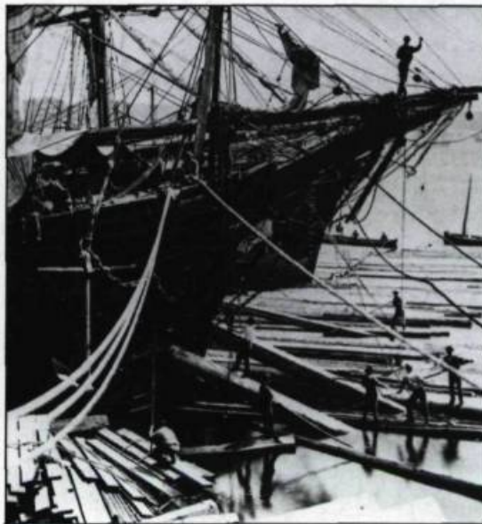
Une fois mesuré, le bois était chargé à bord des grands voiliers en direction de l'Angleterre. Québec, 1872. Photographie de W. Notman. (coll. privée).

À la fin du XIX e siècle, les membres de la vieille bourgeoisie anglophone conservent tout de même des intérêts économiques importants