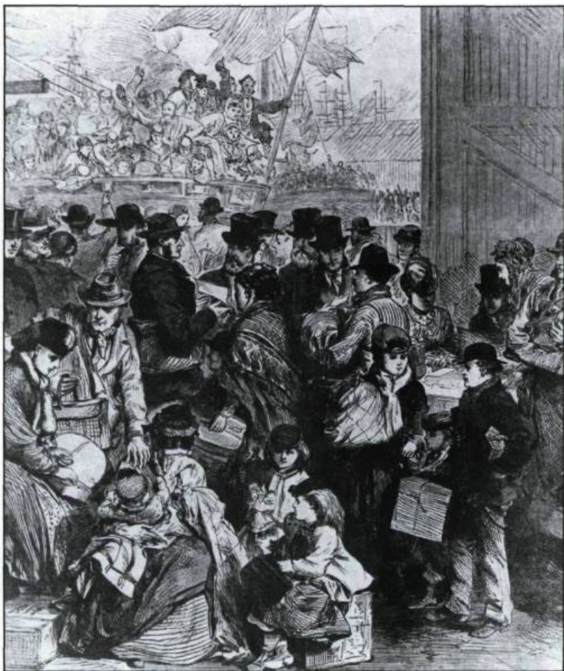
Départ des émigrants pour le Canada.

De nombreux témoignages d'époque et des études historiques font état des conditions pénibles de la traversée sur l'Atlantique, entre les ports anglais et irlandais et Québec. Des capitaines de vaisseaux sans scrupules, alliés à des agents recruteurs, entassaient leurs passagers dans des cales insalubres, et les timides règlements britanniques sur le nombre maximum de passagers par navire n'étaient pas respectés. Pas étonnant dans ces conditions que de nombreux cas de décès, voire des épidémies, se soient déclarés à bord.