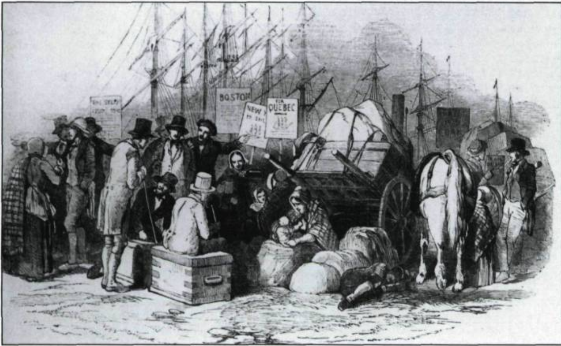
Immigrants attendant le départ de navires pour l'Amérique au port de Cork.