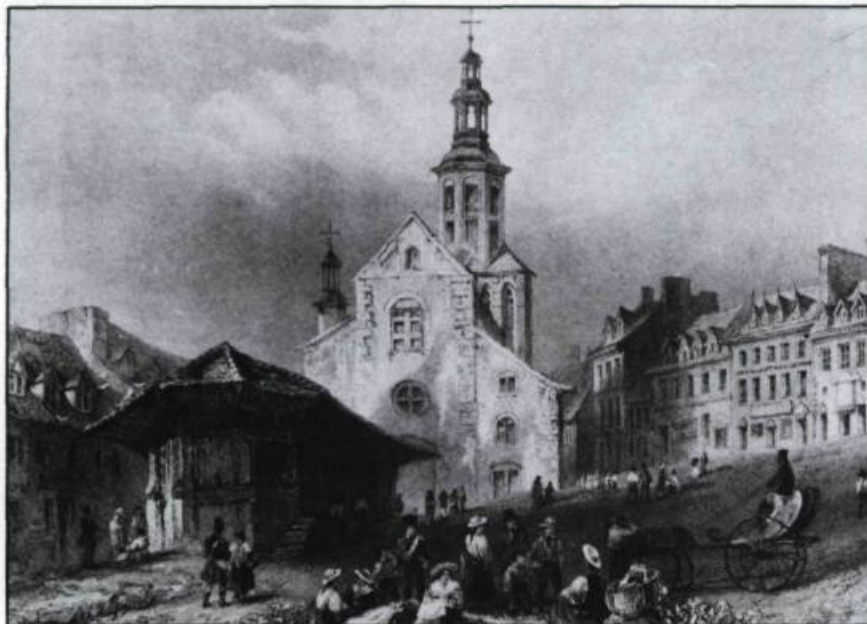
Dans cette autre illustration de la place du marché vers 1830, William Bartlett y confirme son appartenance au mouvement pittoresque. Le traitement des personnages et de l'environnement met en valeur le site en lui donnant un caractère romantique. William Bartlett, «The Market Place» . (Gravure de N.P. Willis, Canadian Scenery Illustrated , Londres, 1842).

Les peintres-topographes qui introduisent cet art au Canada stimulent, par leur habileté et l'abondance de leur production, l'engouement des dilettantes pour l'aquarelle. Parmi ces peintres-topographes de talent, tous hardis voyageurs, quelques aquarellistes féconds nous ont légué des vues de Québec et de ses monu-