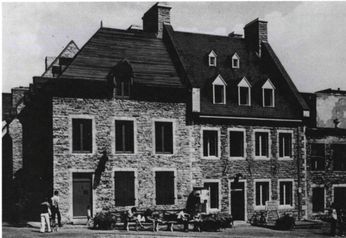
La Maison Lepicard (celle aux trois grandes lucarnes) reconstruite en 1763 et aujourd'hui aménagée en Maison des Vins.

le blé des marchands. La seigneurie de la famille Couillard mérite dès ce moment le titre de «grenier du Bas-district» que lui confèrera Bouchette au début du XIXe siècle.