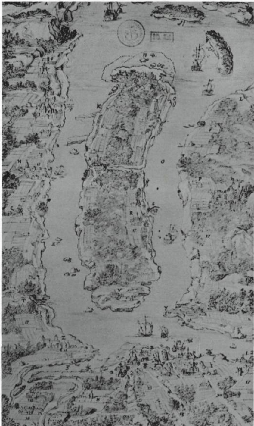
Vue à vol d'oiseau dessinée entre 1668 et 1693. La Côte-du-Sud apparaît à droite de l'île d'Orléans. Bibliothèque nationale. Paris. Cartes et plans.

Avant 1663, la Côte-du-Sud fut surtout un territoire de chasse. La première seigneurie, qui portait d'ailleurs le nom de Bellechasse, fut concédée en 1637 à Nicolas Marsolet. L'occupation permanente ne débutera cependant qu'une trentaine d'années plus tard sur la seigneurie de la famille Couillard, à la rivière du Sud. Avant la venue du régiment de Carignan, il fallait une bonne dose de courage pour aller s'établir à l'écart des principaux noyaux de peuplement constitués par les postes de Québec, Trois-Rivières et Ville-Marie. Nos ancêtres, qui avaient affronté les périls d'une traversée de l'Atlantique, n'en étaient pas dépourvus. Mais, tant qu'il était possible de trouver des bonnes terres à proximité de Québec, une région fréquentée par les bandes iroquoises comme