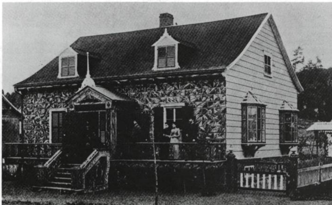
Maison de l'abbé Léon Provancher à Cap-Rouge (1872-1892) située rue Provancher, non loin de l'église paroissiale.

Le bilan de l'oeuvre scientifique de Léon Provancher est considérable. À sa mort, il