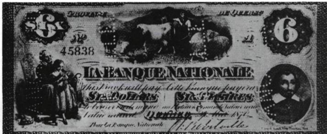
Billet de 6 $ émis par la Banque Nationale en mai 1870. Collection Raymond Boutet.

bre des marchands britanniques venus s'installer dans la colonie. Les Canadiens français, confinés au commerce de détail, distribuaient aux populations locales et régionales les marchandises que leur fournissaient les marchands anglais maîtres du commerce d'import-export. Dans la ville de Québec où, jusqu'au début du XIXe siècle, la population n'atteignait pas les dix mille habitants, les profits de ce petit commerce demeurent nécessairement limités. La croissance spectaculaire des exportations de bois et le développement de la construction navale changent rapidement les données de cette situation dans la première moitié du XIXe siècle. Québec devient une ville bourdonnante d'activités et sa population grossit considérablement, atteignant le chiffre de 58,319 habitants en 1861. Même si le grand commerce d'exportation appartient exclusivement aux anglo-saxons, cette conjoncture, qui permet une expansion du marché local, produit finalement quelques effets favorables dans les rangs des petits commerçants canadiens-français. Quelques-uns parmi eux savent tirer profit des nouvelles conditions économiques et s'introduisent dans le commerce de gros et l'importation.