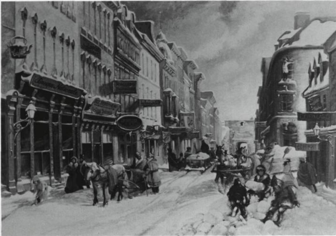
«Banque Nationale 1859», Oeuvre du peintre André L'Archevêque. 1984. On aperçoit au premier plan à gauche l'édifice ayant abrité la Banque Nationale, rue Saint-Jean.