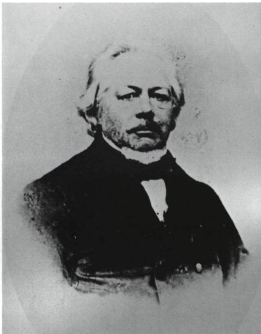
Étienne Parent (1802-1874). Journaliste, fonctionnaire et conférencier réputé, il fut un des premiers au Québec à formuler une doctrine nationaliste mettant l'accent sur la participation au progrès économique.

Ce n'est qu'en 1979 que réapparaît, au moment de la fusion entre la Banque Canadienne Nationale et la Banque Provinciale, le nom de Banque Nationale du Canada, qui évoque les plus lointaines origines de cette institution dont le contrôle appartient toujours à des francophones. Étienne Parent serait sans doute ravi de l'apprendre. □