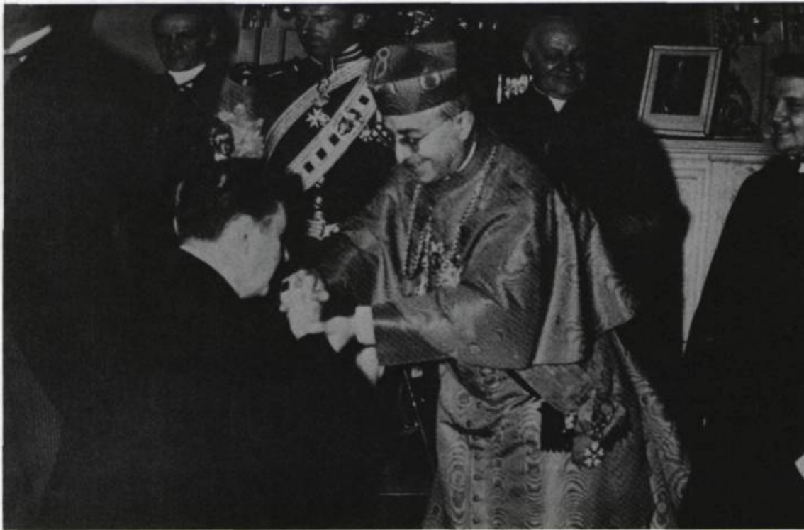
Lors du Congrès eucharistique de juin 1938, Duplessis offre un anneau au cardinal Villeneuve. En recevant l'améthyste cardinalice entourée de diamants, le cardinal le remercie en disant: «Je reconnais dans cet anneau le symbole de l'union de l'autorité religieuse et de l'autorité civile».