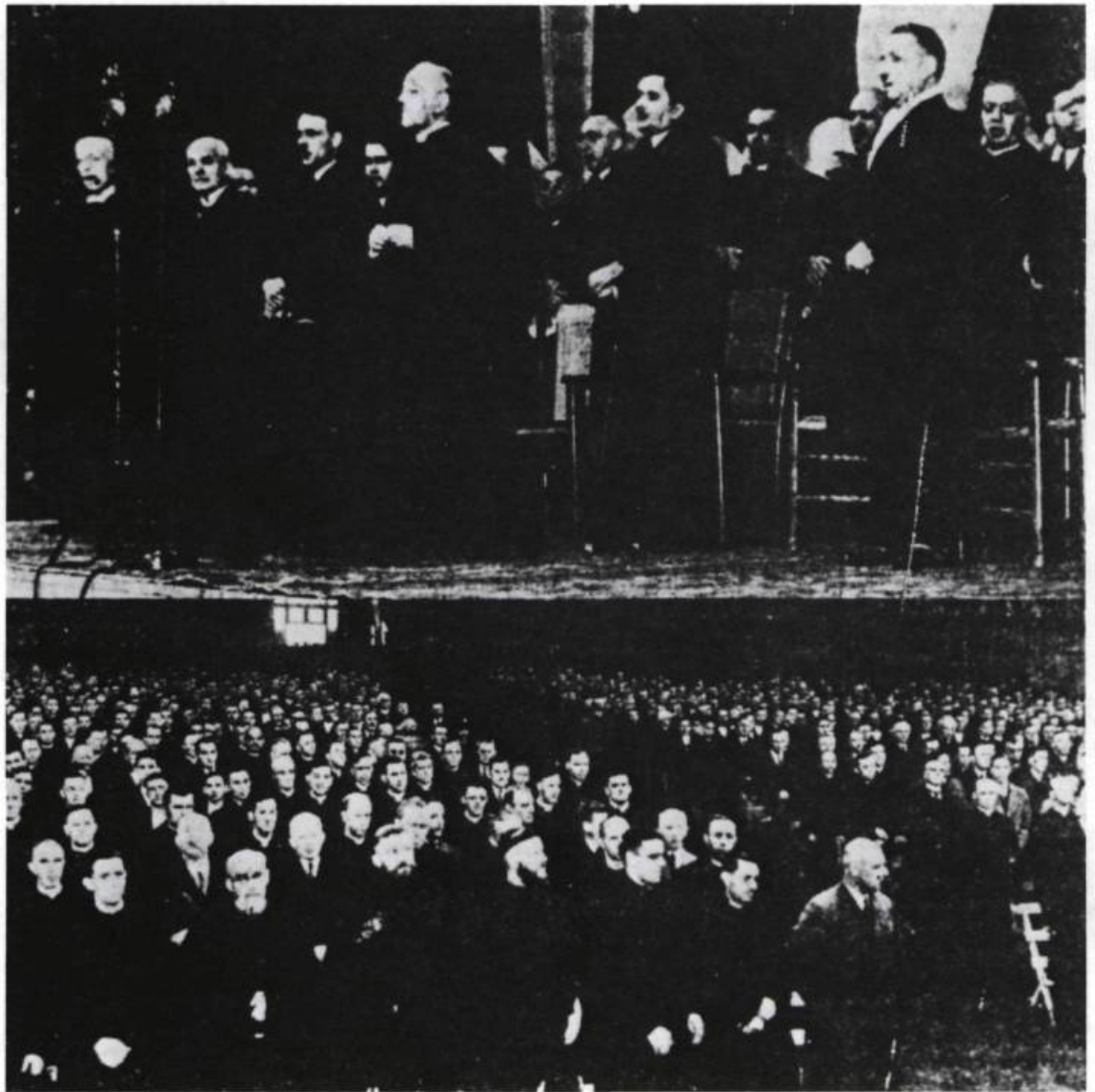
Photos prises au Colisée de Québec lors de la manifestation en l'honneur du Christ-Roi qui regroupa les chefs de l'Église et de l'État ainsi qu'une foule de quinze mille hommes. Le rassemblement visait également à déclarer la guerre au plus vigoureux ennemi de l'Église à l'époque: le communisme. Le Soleil, lundi 26 octobre 1936.

tion en tentant de créer un nouveau crime, celui d'être communiste. Or, le gouvernement fédéral est responsable du Code criminel qui précise les délits. Depuis le rappel par le gouvernement King en 1936 de l'article 98, une législation anti-communiste fédérale, il n'est plus illégal de prêcher le communisme au Canada. Ainsi, la loi du Cadenas est jugée inconstitutionnelle et nulle.