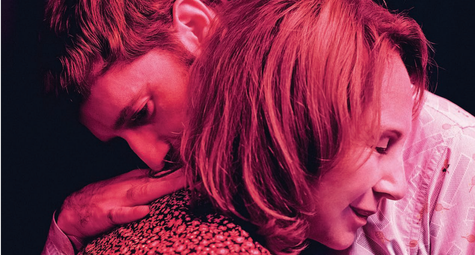
Nathalie Baye et Nicolas Maury dans la magnifique scène du lounge entre une mère et son fils

d'elle-même. Parce que je ne voulais pas une mère trop dessinée. J'ai pourtant adoré la mère qu'elle jouait dans Juste la fin du monde de Dolan, mais ce n'est pas cette incarnation que je souhaitais pour Garçon chiffon . Je désirais une mère matérielle. Je trouve que le plus beau des cadeaux à faire à des acteurs, c'est le temps. En les regardant longtemps. Ces plans-là étaient inévitables pour moi. Je ne voulais pas du tout que ce soit une mère regardée par les yeux du fils. Quand je regarde Nathalie, ce sont les yeux du réalisateur. Ce sont les yeux de l'amour, mais du réalisateur.