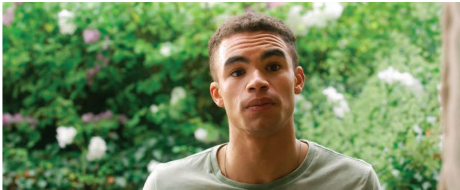
Nicolas Maury (Jérémie), Arnaud Valois (Albert) et Théo Christine (Kevin) dans Garçon chiffon

Vous vous mettez complètement à nu dans ce film comme acteur, mais aussi comme réalisateur. Vous dévoilez une très grande vulnérabilité. Est-ce que marcher sur un fil si mince vous a donné le vertige?