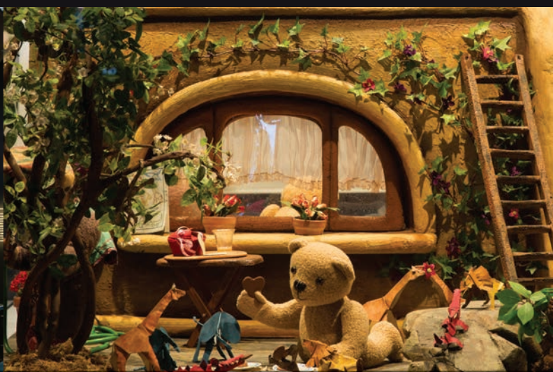
De haut en bas et de gauche à droite: Vue d’ensemble de la salle d’exposition / Maquette du film Dehors novembre (2005) de Patrick Bouchard / Studio où les cinéastes en résidence travailleront en direct sous les yeux des visiteurs / Un exemplaire des chaises d’ Il était une chaise (1957) de Norman McLaren et la monteuse son et image utilisée par le cinéaste vers 1955 / Décor du film Ludovic – Un croco dans mon jardin (2000) de Co Hoedeman — Photos: Jessy Bernier / Perspective