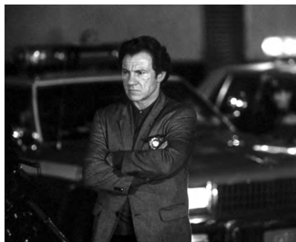
Marlon Brando ( On the Water Front ), Robert De Niro ( Raging Bull ), Christian Bale ( The Machinist ), Al Pacino ( Serpico ) et Harvey Keitel ( Bad Lieutenant )

pêtrées dans des productions luxueuses et désincarnées où la réalité sociale n'avait aucune valeur. Le cinéaste John Cassevetes peut par ailleurs se targuer d'avoir été à cet égard un précurseur, lui qui laissait les acteurs libres d'improviser les scènes de son film Shadows en 1960.