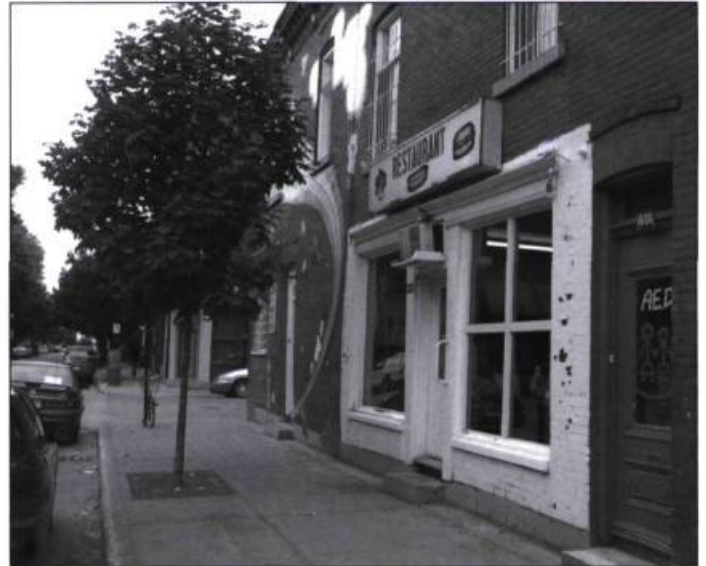
La cour de l'École Baril et le casse-croûte