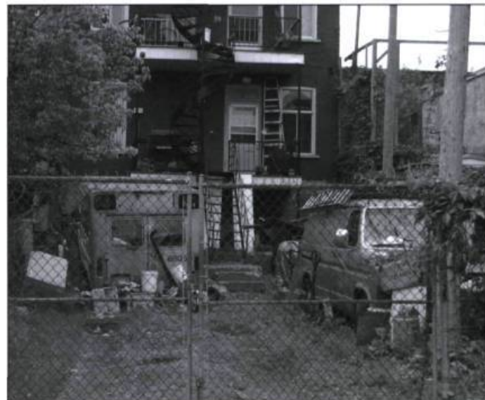
Une des cours visitées par le garçon pour ses livraisons...