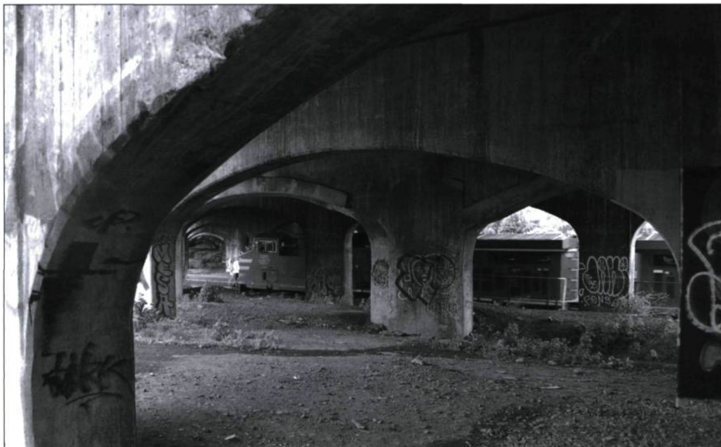
Sous le viaduc Sainte-Catherine au coin de Bercy