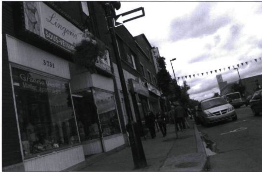
Le secteur de la rue Ontario où les enfants passent l'Halloween