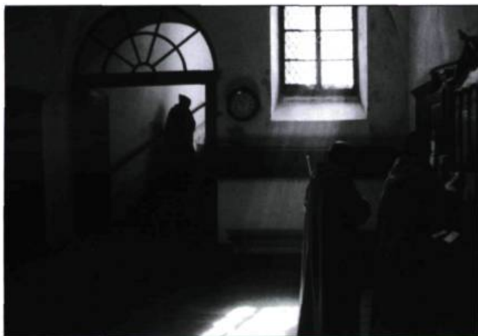
Le Grand Silence