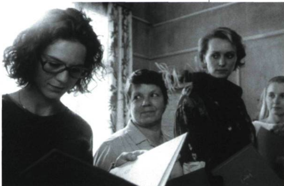
... et revenant du camp de vacances

Volker Schlöndorff: À vrai dire, ma participation se limitait à tenter d'adapter les studios à un autre système de production, plus moderne. Aujourd'hui c'est à 80% un studio de télévision et 20% de cinéma... Disons que j'espère tout simplement que le cinéma, en Europe comme ici, n'aura pas à se réduire à des petits films personnels, comme celui que je viens de tourner et que j'aime beaucoup tout de même. Car le cinéma existe aussi pour qu'on puisse réaliser des films de grande envergure, des films de contenu européen qui auraient la dimension des films américains. Je crois qu'il ne faut pas renoncer à cela, sinon on est réduit à passer pour une sorte de petit cinéaste amateur et dilettante... ■