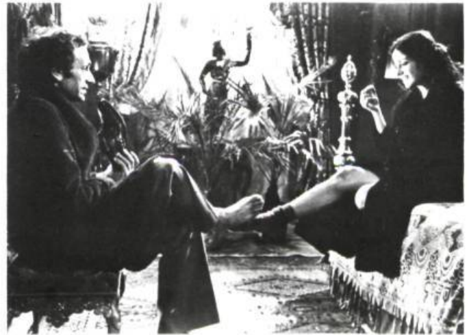
Maman a cent ans.