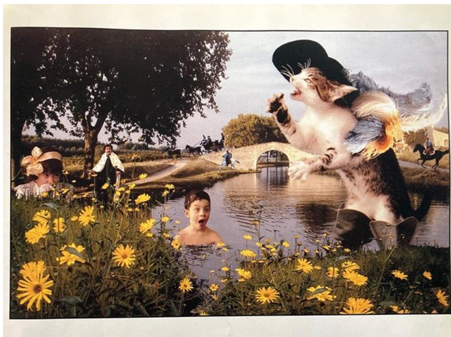
Frank Horvat et Véronique Aubry, Yao le chat botté (1992)

Photomontage tiré de Frank Horvat et Véronique Aubry, Yao le chat botté , Paris: Hachette/Gautier-Languereau, 1992, n.p.