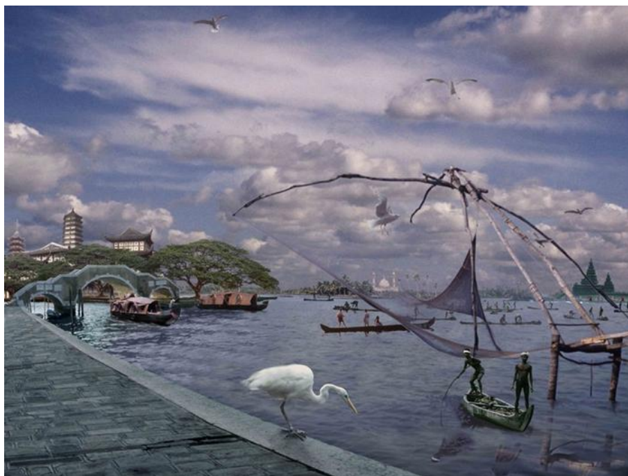
Frank Horvat, Agora (1992)

Oeuvre présentée lors de l'exposition L'épreuve numérique , Palais de Tokyo du 6 novembre 1992 au 18 janvier 1993.