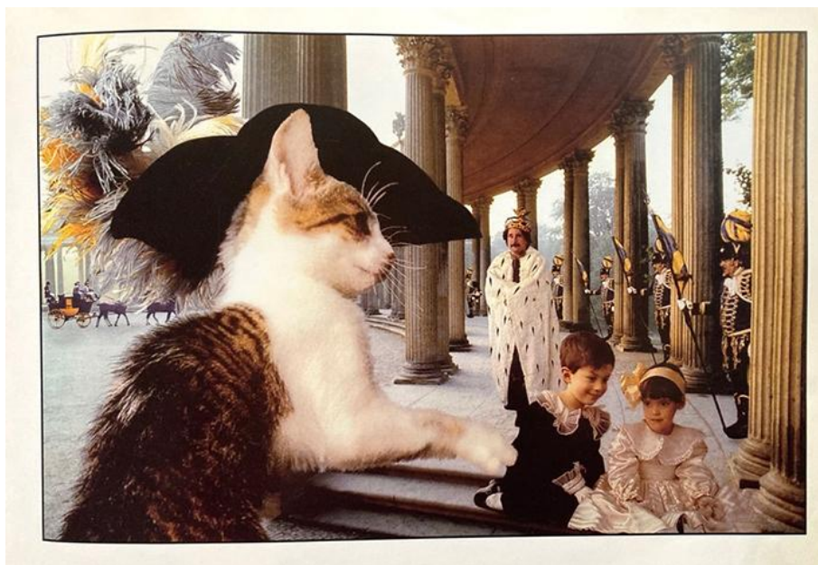
Frank Horvat et Véronique Aubry, Yao le chat botté (1992)

Photomontage tiré de Frank Horvat et Véronique Aubry, Yao le chat botté , Paris: Hachette/Gautier-Languereau, 1992, n.p.