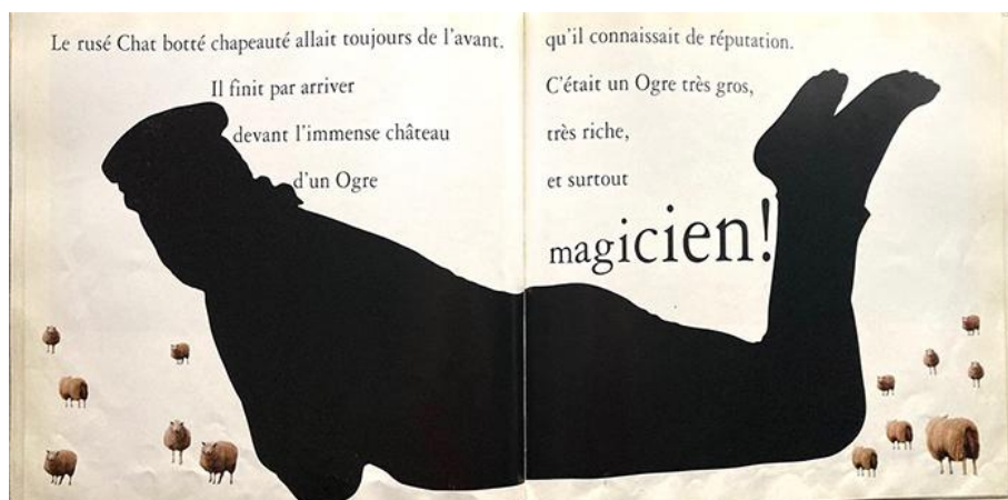
Frank Horvat et Véronique Aubry, Yao le chat botté (1992)

Pages tirées de Frank Horvat et Véronique Aubry, Yao le chat botté , Paris: Hachette/Gautier-Languereau, 1992, n.p.