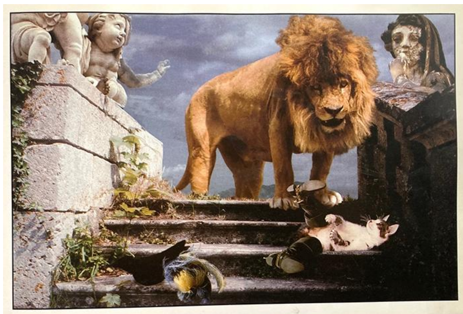
Frank Horvat et Véronique Aubry, Yao le chat botté (1992)

Photomontage tiré de Frank Horvat et Véronique Aubry, Yao le chat botté , Paris: Hachette/Gautier-Languereau, 1992, n.p.