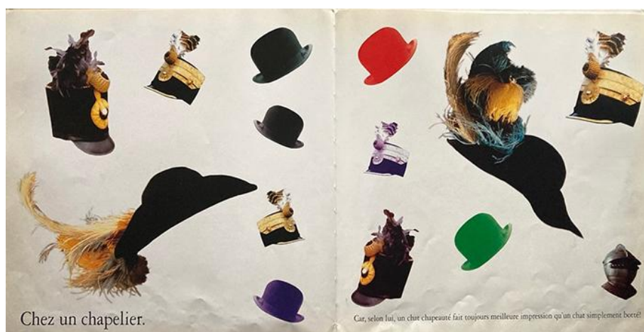
Frank Horvat et Véronique Aubry, Yao le chat botté (1992)

Pages tirées de Frank Horvat et Véronique Aubry, Yao le chat botté , Paris: Hachette/Gautier-Languereau, 1992, n.p.