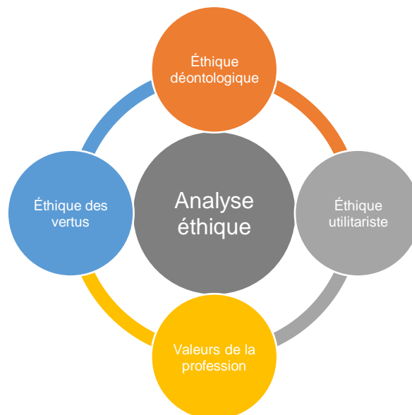
Figure 3 : Les quatre lunettes éthiques du Cadre éthique quadripartite

En quoi ces données sont-elles pertinentes et intéressantes d'un point de vue éthique? Cette section présente une réflexion sur ces données et leurs implications éthiques. À l'aide du Cadre éthique quadripartite [23], quatre analyses éthiques sont articulées (voir la Figure 3).