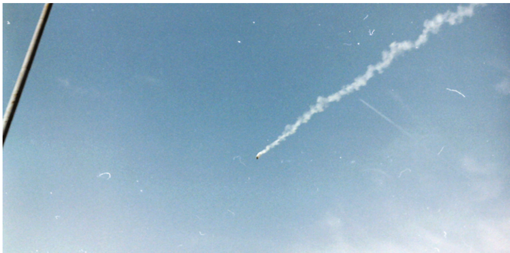
Manifestation à Québec le 21 avril 2001 lors de la 2 e journée du Sommet des Amériques.

Par la suite, certaines associations étudiantes, comme l'Association étudiante du