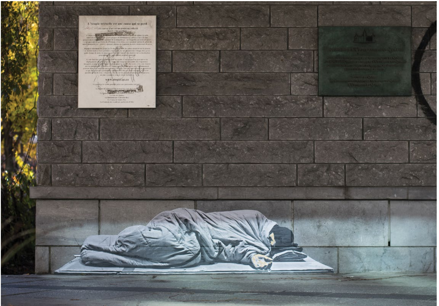
Graffiti sur la place de l'Université-du-Québec, Québec.