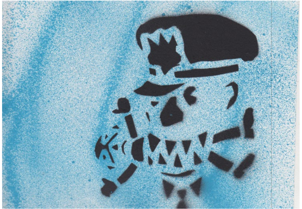
Bœuf. Pochoir: Ramon Vitesse.

Les forces policières font leur part pour déstabiliser les efforts des parents des jeunes noir·e·s et autochtones, et ce, dès un jeune âge. La police envoie un message clair à ces jeunes en les suivant dans la rue, en les tabassant, en leur demandant constamment leurs papiers, en rôdant dans leurs quartiers, en harcelant leur famille, sans égard pour leur dignité ni leur vie privée, sous prétexte de chercher un suspect ou d'assurer la sécurité. Le message passé à tou·te·s les Autochtones et Noir·e·s est que notre présence même dans l'espace public et dans la société pose problème.