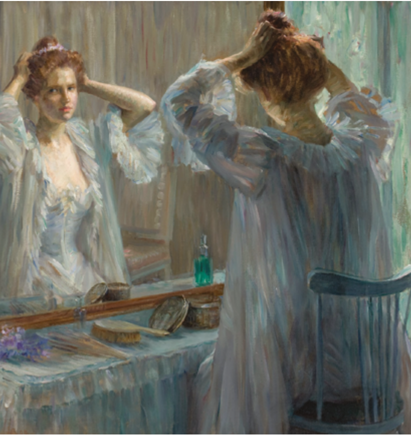
La Toilette. Peinture: Louise Catherine Breslau, 1898.

« Puis c'est là quand on arrête de se réactualiser, quand on arrête de se remettre en question, quand on arrête de suivre le rythme du monde et être actuelle, c'est là qu'on commence à devenir vieux parce qu'on reste figé dans notre temps. »