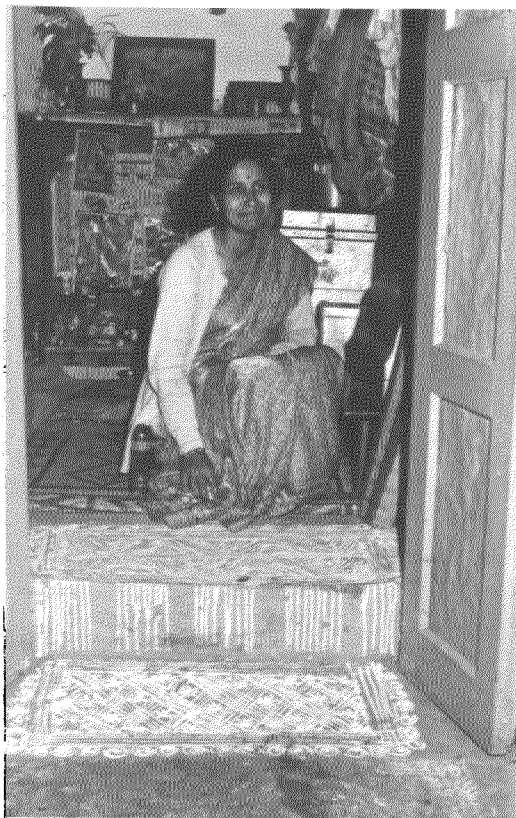
Femme kumaonie ornant le temple de sa maison d'un aipan

Partout en Asie du Sud, les femmes hindoues pratiquent l'art rituel comme partie intégrante de centaines de fêtes et de cérémonies. L'art rituel des femmes