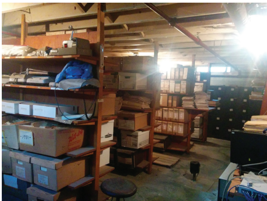
Figure 4 : Vue générale du sous-sol. Le sous-sol comporte des étagères en bois fixées au plafond. À la suite du dégât d'eau, des trottoirs en bois ont été installés dans les allées. On distingue la pompe submersible au plancher. Source : Anne-Marie Charuest.

plusieurs années, et, en cas de déclenchement, il est clair que les documents seront grandement affectés, particulièrement au grenier où aucun contenant ni tablette fermée ne les protègent. À chacune de nos visites au sous-sol et au grenier, nous avons constaté que des documents et des dossiers étaient laissés sur les tables ou le dessus des classeurs, en attente d'être reclassés. Certains calepins et dessins techniques avaient visiblement été oubliés là depuis longtemps.