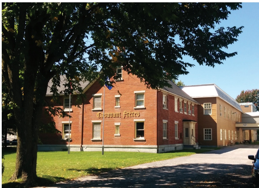
Figure 2 : Une partie du complexe industriel de Casavant Frères en 2017. Vue extérieure de l'édifice administratif de Casavant Frères, dont la partie droite est l'ancienne résidence de Joseph Casavant.

1982. L'entreprise est localisée au sein d'un complexe industriel majeur comportant plusieurs bâtiments, incluant la maison patrimoniale de Joseph Casavant, construite en 1852 5 .