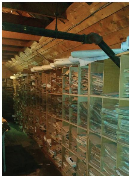
Figures 5 et 6 : Dessins mécaniques (à gauche) et dossiers techniques (à droite) au grenier.

Ce secteur du grenier est sans contredit le plus fréquenté par les utilisateurs. Le mur gauche est rempli d'étagères à dessins, tandis que le mur droit contient les dossiers techniques (calepins) dans des casiers de bois. On remarque les plans d'architecture provenant des clients, au-dessus des casiers.