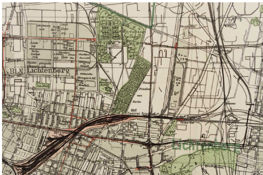
Figure 2: Projet Kartograph, 1938/2015 Berlin.