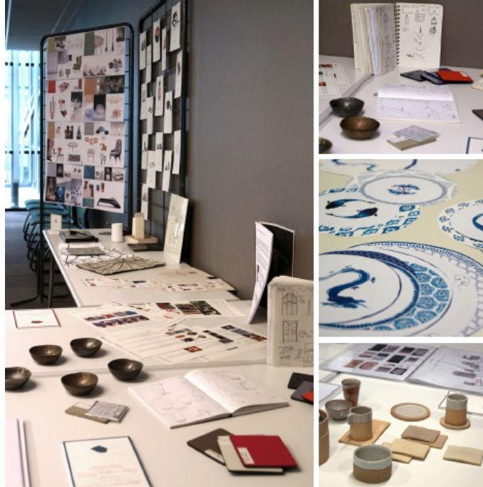
Figure 2. Poïétique du design, entre l'expérience et le discours. Exposition de travaux à la soutenance de thèse ( yume Design Studio , septembre 2014).

profils experts. Quant au doute, il n'est plus complexe d'imposture, mais s'apaise et devient un moteur.