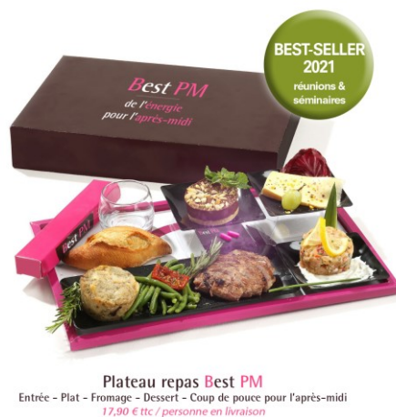
Figure 3. Le plateau-repas « coup de pouce » pour jeunes actifs contient deux pilules d'amphétamines : « Best PM vous donne de l'énergie pour l'après-midi! » ( yume Design Studio , pour politic-fiction.fr , avril 2017).