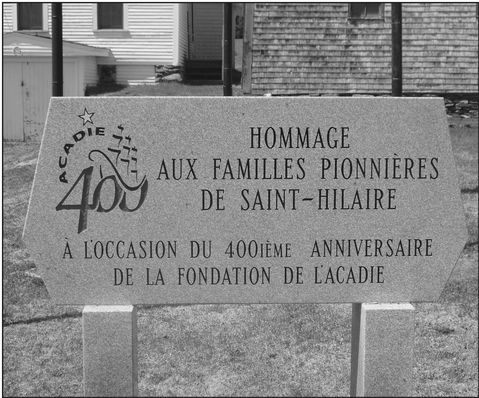
Figure 3: Monument du 400 e anniversaire de l'Acadie, Saint-Hilaire.