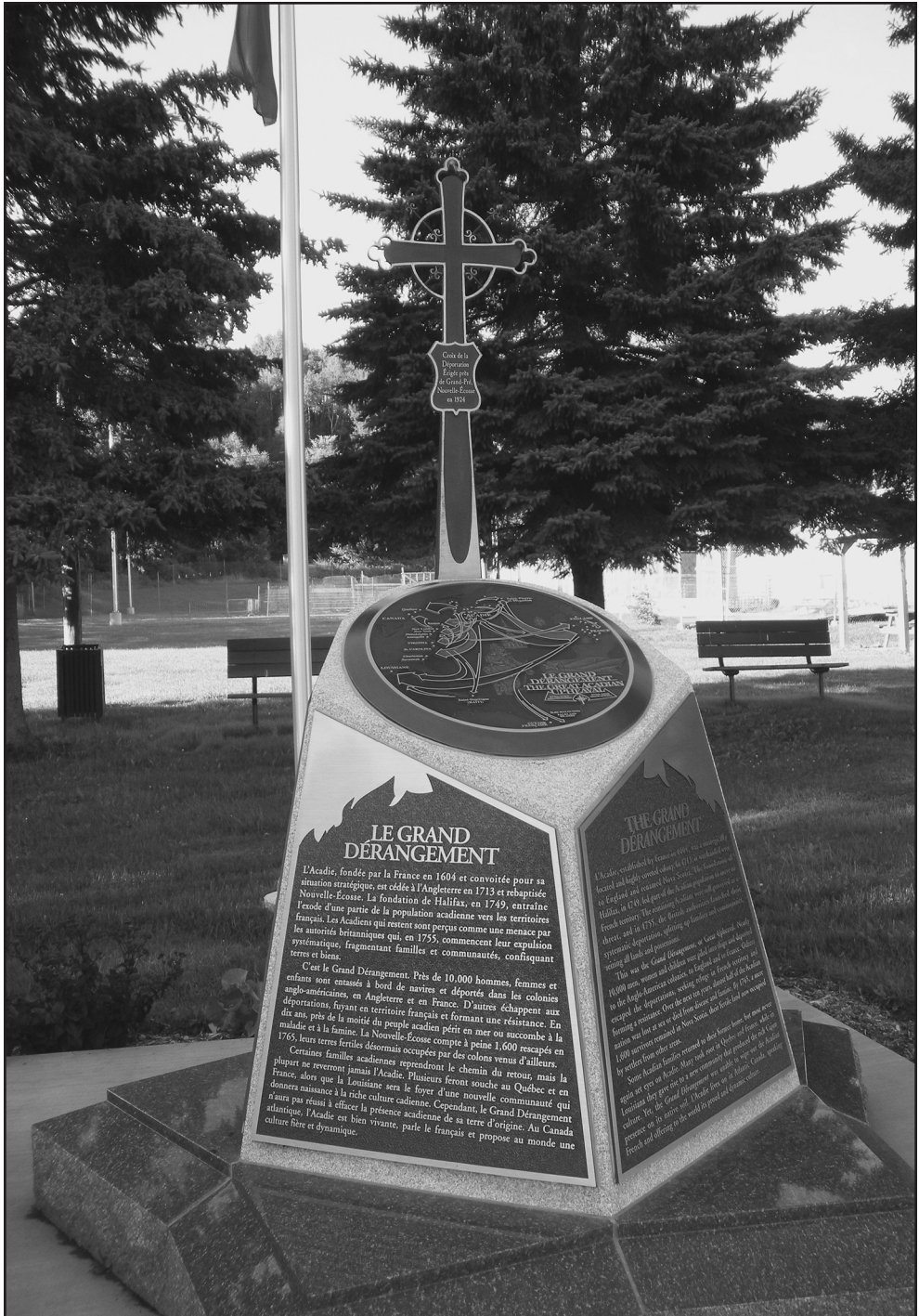
Figure 4: Monument de l’Odyssée acadienne, Saint-Basile.