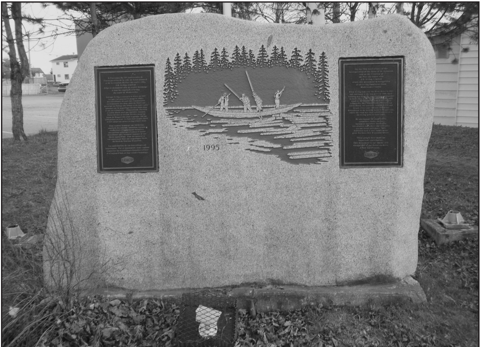
Figure 9: Monument en hommage aux draveurs.

Saint-Léonard.