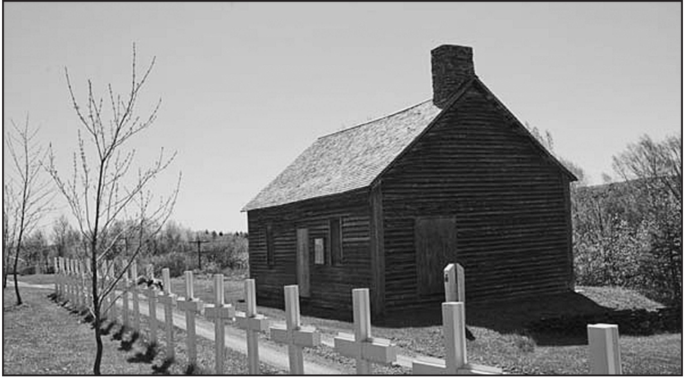
Figure 7: Maison Cyr, Saint-Basile.