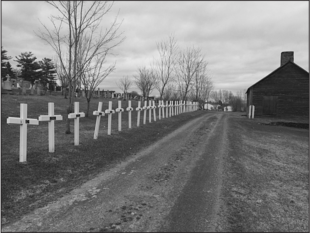
Figure 1: Croix en mémoire des familles fondatrices, Saint-Basile.