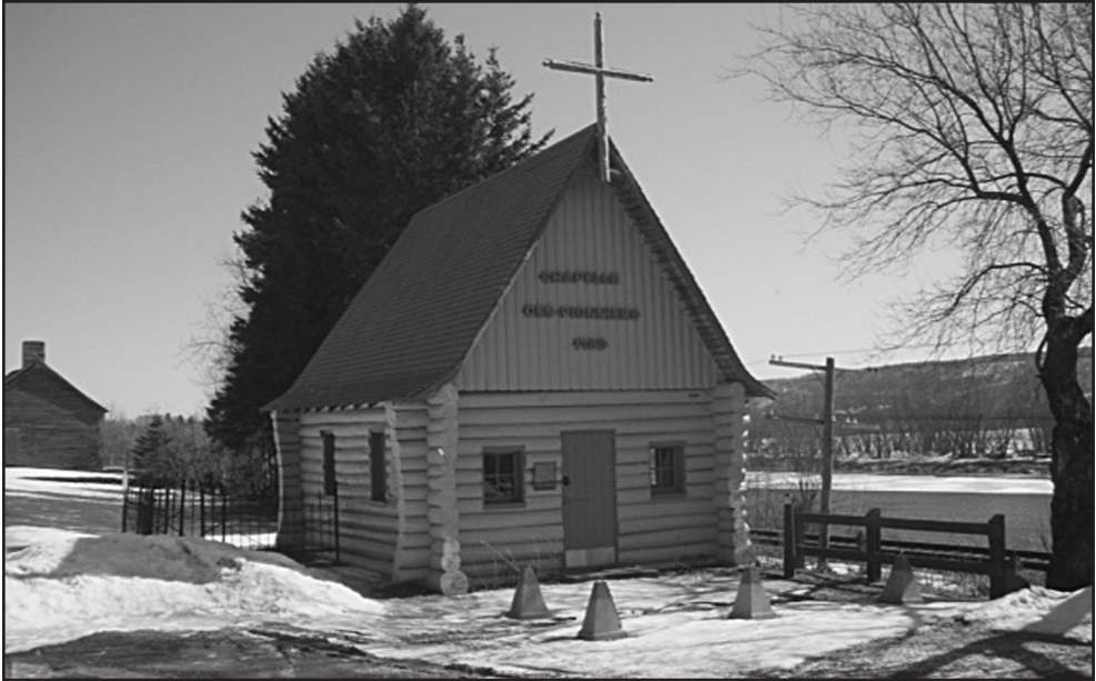
Figure 8: Chapelle historique, Saint-Basile.