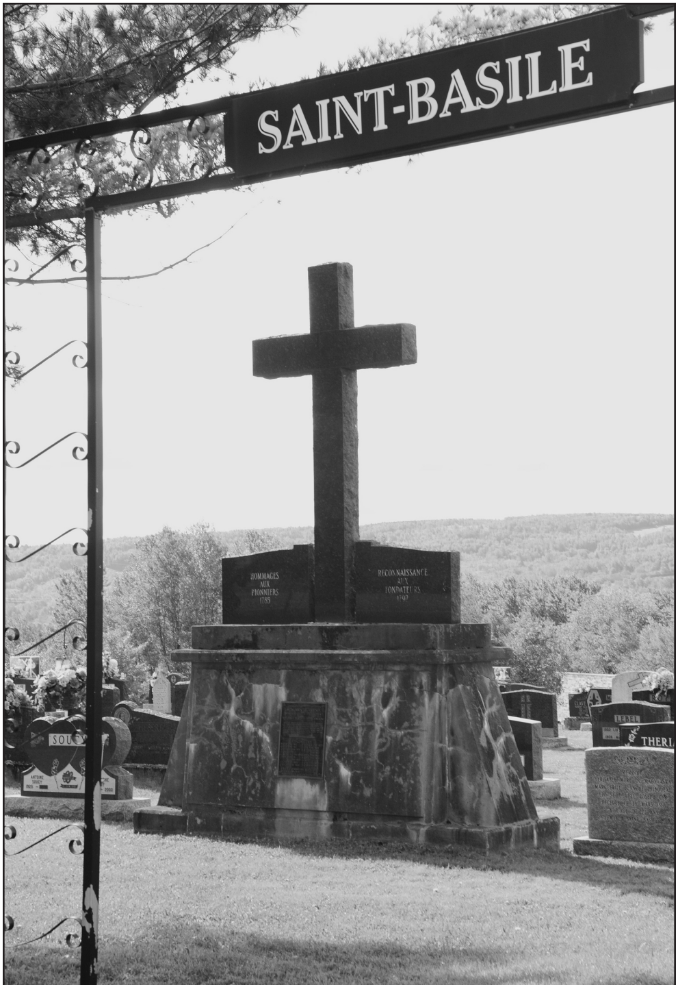
Figure 2: Monument aux fondateurs, Saint-Basile.