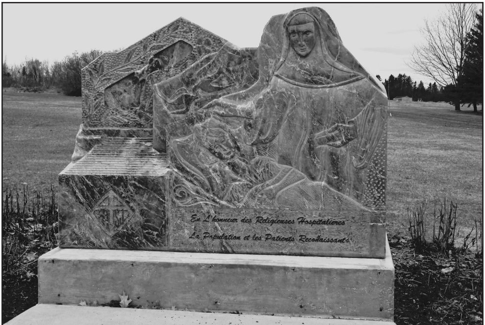
Figure 11: Monument en hommage aux RHSJ, Saint-Quentin.