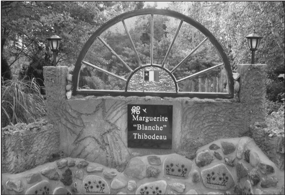
Figure 5: Lieu en hommage à Tante Blanche, jardin de Gus.