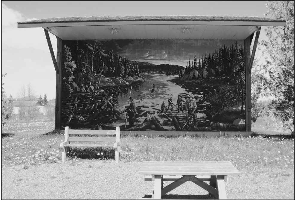
Figure 10: Fresque en hommage aux draveurs, Saint-Léonard.