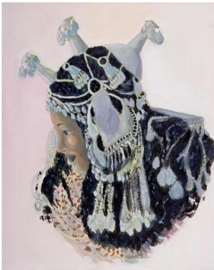
Femme gorane (Toubou) porte le djoko culturel. Acrylique sur toile 46 x 61 cm.