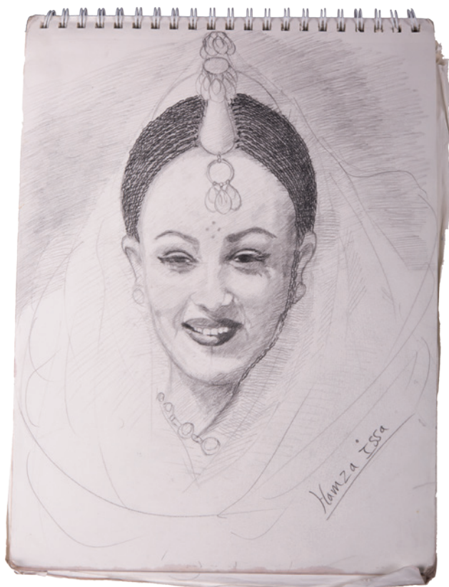
Femme gorane (Toubou) au festival International de culture saharienne.

Après mon retour au pays au mois de décembre 2015, j'ai repris mes études, car j'avais promis à mon père de continuer dans les arts