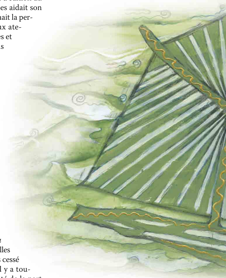
Illustration: Maryam Tavaf

Portés par un excès d'enthousiasme, Jules et moi avons senti le devoir d'en