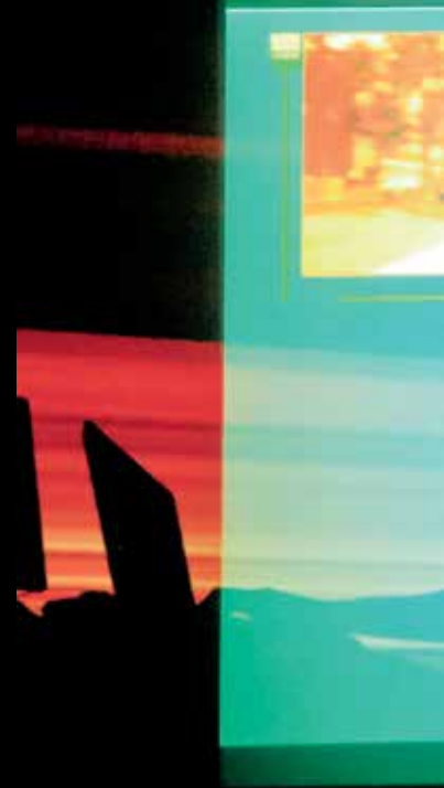
Contact, performance médiatique, Hp Process, Société des arts technologiques, 2013.