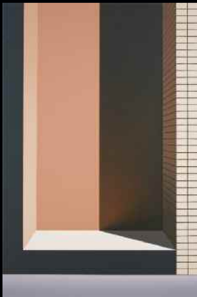
Alcôve (19th Street), 2008. Huile sur toile de lin, 183 x 122 cm. Don de M. Jamie Johnson ; collection Musée d'art contemporain de Montréal.

Tout récemment, sa rétrospective Pierre Dorion au Musée d'art contemporain, à l'automne 2012,