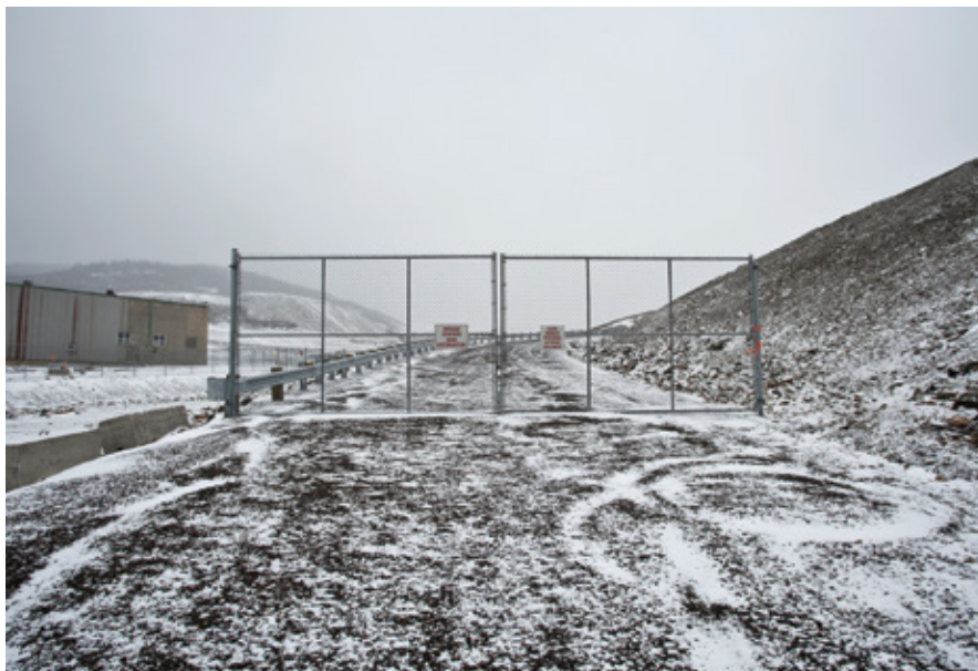
Myriam Gaumond, De la série Le vent est tombé , 2017

Ici, une borne incognito, là, un simple panneau, une barricade bancaire ou un barbelé usé : Sur la ligne frontière était présentée dans le Parc de la Pointe Taylor à New Richmond, superbe parcours à l'orée de la forêt, où une procession de boîtiers attendait le visiteur. Ici, l'intégration des œuvres est plus réussie, nichée au cœur d'une clairière tapissée d'aiguilles d'épinettes. Les postes frontaliers à ciel ouvert captés par l'artiste faisaient littéralement écho au lieu d'exposition,