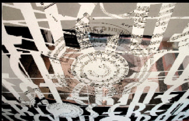
Cantate (2006). Hauteur 5070 mm x 18500 mm. Acier inoxydable miroir et acrylique. Foyer de la salle Raoul-Jobin, Palais Montcalm, Ville de Québec avec PIAAGQ. Détail.

Ainsi Dispositif n° 0312 (2012), œuvre conçue pour le Centre multisports de Vaudreuil-Dorion, a été réalisée avec la collaboration de ses citoyens. Selon Goulet, cette démarche représente un moment charnière de son parcours artistique, puisque la notion de contexte prend ici toute sa signification, toute son étendue. L'artiste a posé une question à laquelle devaient répondre différents groupes, dont des enfants d'âge scolaire, des adolescents, des adultes et des aînés, de toutes provenances socioéconomiques et ethnoculturelles. Goulet a réalisé des captations vidéo des sessions de travail avec ses sujets et, à partir de leurs réponses, a tissé son œuvre suspendue au plafond, assemblée par de longs fils auxquels se sont accrochés de courtes phrases ou énoncés, dans les langues maternelles des participants. L'œuvre, aperçue en contre-plongée du hall du centre sportif, se révèle comme un nuage de mots, une nuée syntaxique polyglotte flottant au-dessus de nos têtes. Sur le plan formel, les calligraphies variées des