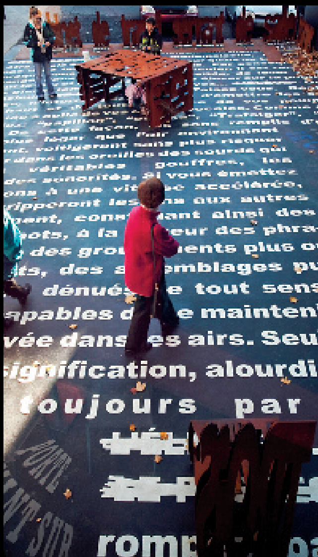
La (les) leçon(s) plurielle(s) (2011).