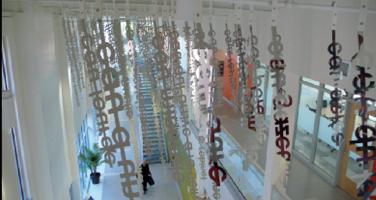
Monument pour P, averse III (2011). Largeur du texte 100 mm, longueurs variables. Acier inoxydable, aluminium brossé et laqué. Installation intérieure, couloir de circulation entre la piscine et l'aréna, Centre des loisirs, Saint-Lambert, PIAAGQ. Détail de la plate-forme de montage.

Pour l'une de ses plus récentes commandes publiques, cette conversation a pris une tout autre dimension puisque le commissionnaire avait indiqué son désir de voir les artistes concurrents imprégner leur œuvre des liens qu'ils auraient établis avec la communauté environnante, en amont de son intégration au bâtiment, par une approche de médiation culturelle déjà bien ancrée dans la municipalité.