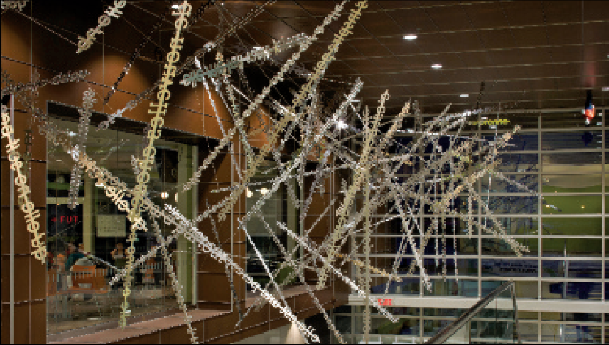
Dispositif n° 0312 (2011-2012). L'ensemble: longueur: 14000mm, largeur : 4700 mm et hauteur : 3500 mm, hauteur de la typo : 100 mm. Acier inoxydable miroir et brossé câble et fixation en acier inoxydable. Installation intérieure réalisée avec la collaboration des usagers, Centre multisports, Vaudreuil-Dorion, PIAAGQ.