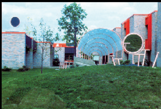
L'autre île (1982). Acier peint, dalles de béton, béton, roche de plage, sable, plantation, miroir et ardoise. Cours arrière, Centre d'Accueil de Montarville, devenu CHSLD Montarville, St-Bruno de Montarville (PIAAGQ).

Peu de temps après la fin de ses études universitaires de premier cycle qui, dit-elle, l'avaient quelque peu laissée sur sa faim, Goulet obtient une résidence au Banff Centre for the Arts qui allait s'avérer déterminante pour son parcours. Lors de ce stage, elle se trouve en contact avec l'artiste américain Allan Kaprow qui y est invité pour donner une conférence. Kaprow est notamment célèbre pour son invention des happenings en 1959, avec 18 Happenings in Six Parts (terme qu'il a d'ailleurs répudié, quelques années après son usage un peu galvaudé), et des assemblages, mieux connus maintenant sous le vocable