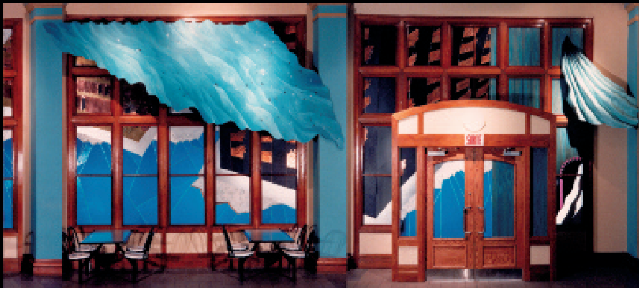
Lénigme de la générale (1987-1988) ; 6096mm x 30480mm. Fibre de verre, bois teinté et vernis, photographie laminée, stratifié sur contre-plaqué, cuivre et laiton sur contre-plaqué, verre antique, acrylique, tube de cuivre oxydé. Cafétéria du CEGEP Dawson, Montréal, dans le cadre de la politique d'intégration des arts à l'architecture du gouvernement du Québec (PIAAGQ). Détail de deux des six sections composant la murale.

et s'est conséquemment interrogée sur des questions relatives à l'origine de l'œuvre et à son lieu d'implantation. Qu'est-ce qui doit advenir en premier lieu ? L'œuvre, le bâtiment ou la trame urbaine ? La quadrature du cercle, en somme...