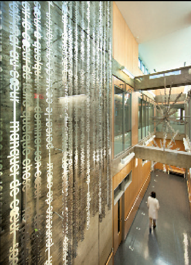
Une affaire de cœur (2011). Largeur du texte 100 mm, longueurs variables. Acier inoxydable, aluminium brossé et laqué. Installation intérieure couloir de circulation, Institut de cardiologie de Montréal, PIAAGQ.

un état de réflexion profonde. Le personnage agit aussi comme étalon de l'échelle humaine, qui permet de faciliter l'observation de l'œuvre dans sa globalité et, à la limite, de faire basculer notre lecture de l'espace lui-même. Notre protagoniste positionné tête-bêche symbolise en définitive l'esprit du lieu, gardien de la question secrète, qui veille sur la multitude de réponses fournies par les auteurs attentionnés devenus collaborateurs irréductibles de l'artiste.