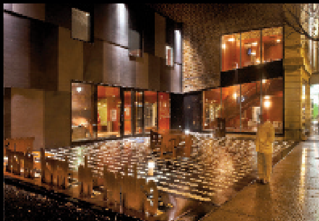
La (les) leçon(s) plurielle(s) (2011), 7600mm x 13700 mm, éléments 3D : hauteur maximale 1200mm. Dalle de béton, polymères, acier corten, éclairage. Extrait de La leçon , Eugène Ionesco, 1994. © Éditions Gallimard. Parvis de la salle Fred-Barry, Théâtre Denise-Pelletier, Montréal, PIAAQ.