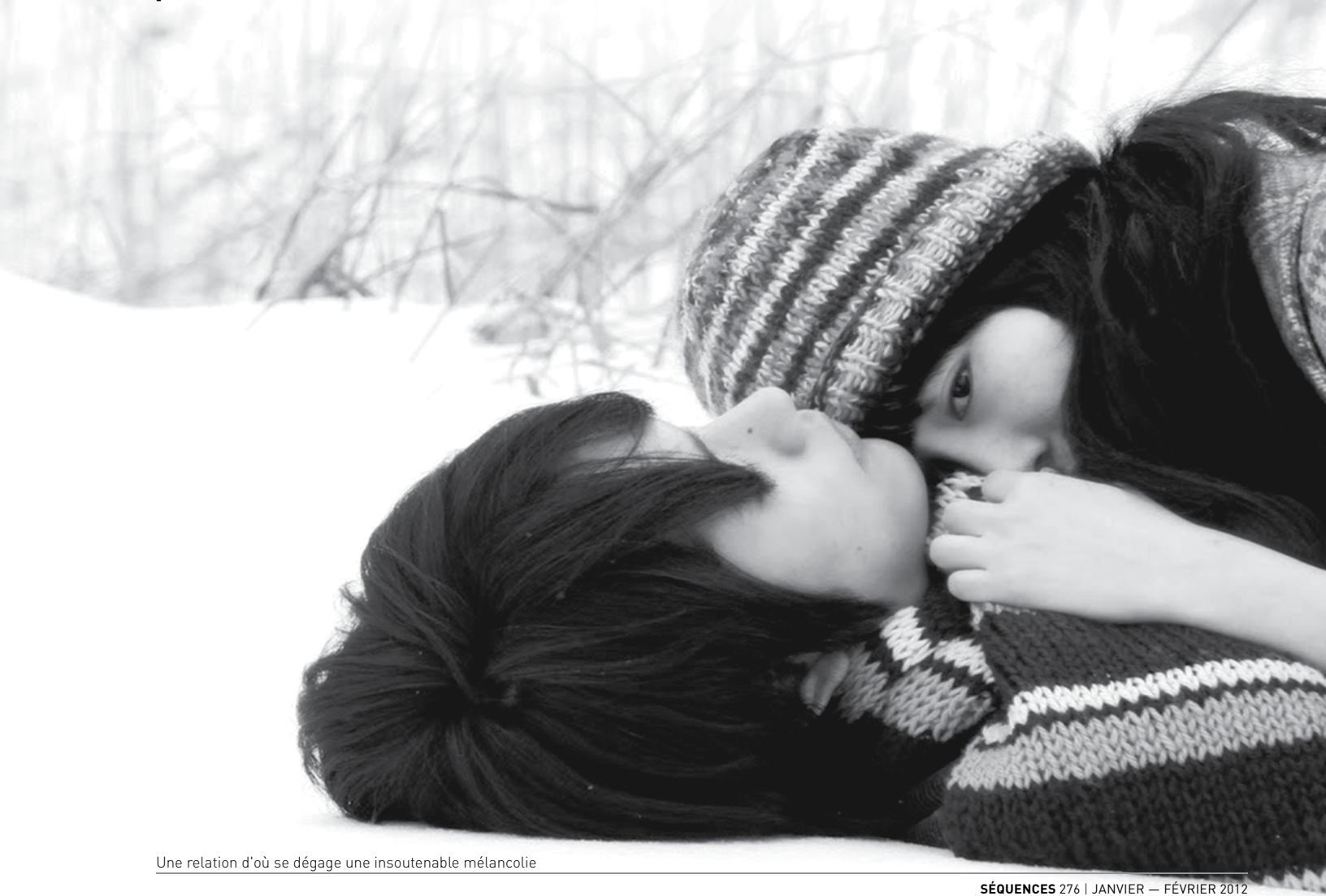
Une relation d'où se dégage une insoutenable mélancolie