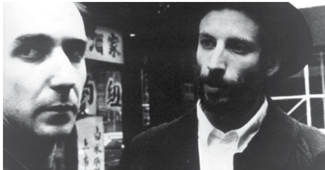
Un noir et blanc qui éradique le gris

U En réalisant Pi , Aronofsky faisait naître son premier long métrage avec très peu de moyens. Sans producteur ni maison à hypothéquer, le jeune cinéaste avait emprunté 100 $ à ses amis et leur avait promis que 150 $ leur reviendraient si la sortie du film pouvait suffire à rembourser ses frais. Aucun d'entre eux ne se doutait bien sûr qu'une œuvre sur l'obsession mathématique — qualifiée de « passionnant devoir d'école » par Positif — encaisserait trois millions de dollars américains et remporterait le prix de la mise en scène à Sundance en 1998. Enfant terrible des studios, Aronofsky multiplie depuis les projets ambitieux et sait enjamber avec adresse les dangers que seuls les grands réalisateurs savent contourner. Ce front et cette ardeur lui ont valu plusieurs critiques acerbes; Aronofsky en est sorti indemne dans tous les cas.