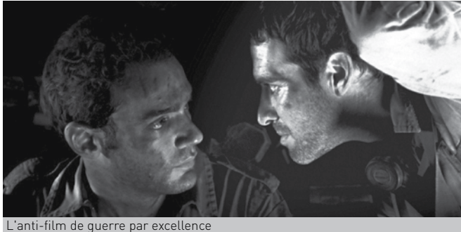
L'anti-film de guerre par excellence

Né à Tel-Aviv en 1962, Samuel Maoz a réalisé quelques courts métrages, entre 1987 et 2000, et de nombreuses publicités. En 1982, il est mobilisé comme artilleur dans les divisions blindées. Du Liban, Maoz est revenu hanté par ce qu'il a fait, par ce qu'il a vu. Lebanon , qui a obtenu le Lion d'or au dernier festival de Venise, retrace l'expérience personnelle de ce soldat israélien qu'était à l'époque le cinéaste. Par quel exorcisme, par quelle magie se sort-on d'un tel traumatisme : par l'écriture, par la peinture, par le cinéma lorsqu'on est cinéaste ?