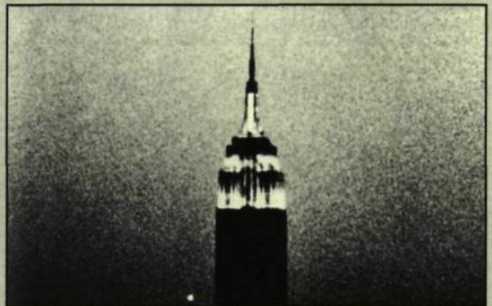
Empire d'Andy Warhol

Quelques nuits plus tard. Toujours au coin de Guilbault, cette fois-ci le Festival nous convie à la Première mondiale de Strange World , le film concert qu'a réalisé François Girard, en Italie, lors de la tournée de Peter Gabriel. Ce soir, la nature se met de la partie pour transformer une réalisation un peu banale en show inoubliable. Je dis banale parce que Girard n'a pas pu ou n'a pas su créer une véritable mise en scène cinématographique. À une exception près, ses caméras se contentent de filmer l'action de l'espace hors scène. Pratiquement aucune interaction, donc, entre la lentille et Gabriel; aucune