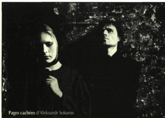
Pages cachées d'Aleksandr Sokhurov

Le Prince avait demandé un premier brevet aux États-Unis en 1886 pour une ciné-caméra-projecteur stéréoscopique à seize lentilles. En 1888, il fait une nouvelle demande, cette fois en Angleterre, pour une version modifiée de sa caméra en ajoutant qu'elle peut ne comporter qu'une lentille. Il tourne la même année les trois premiers films connus de l'histoire du cinéma, dont celui où l'on voit son fils Adolphe jouant de l'accordéon. Aujourd'hui, il ne